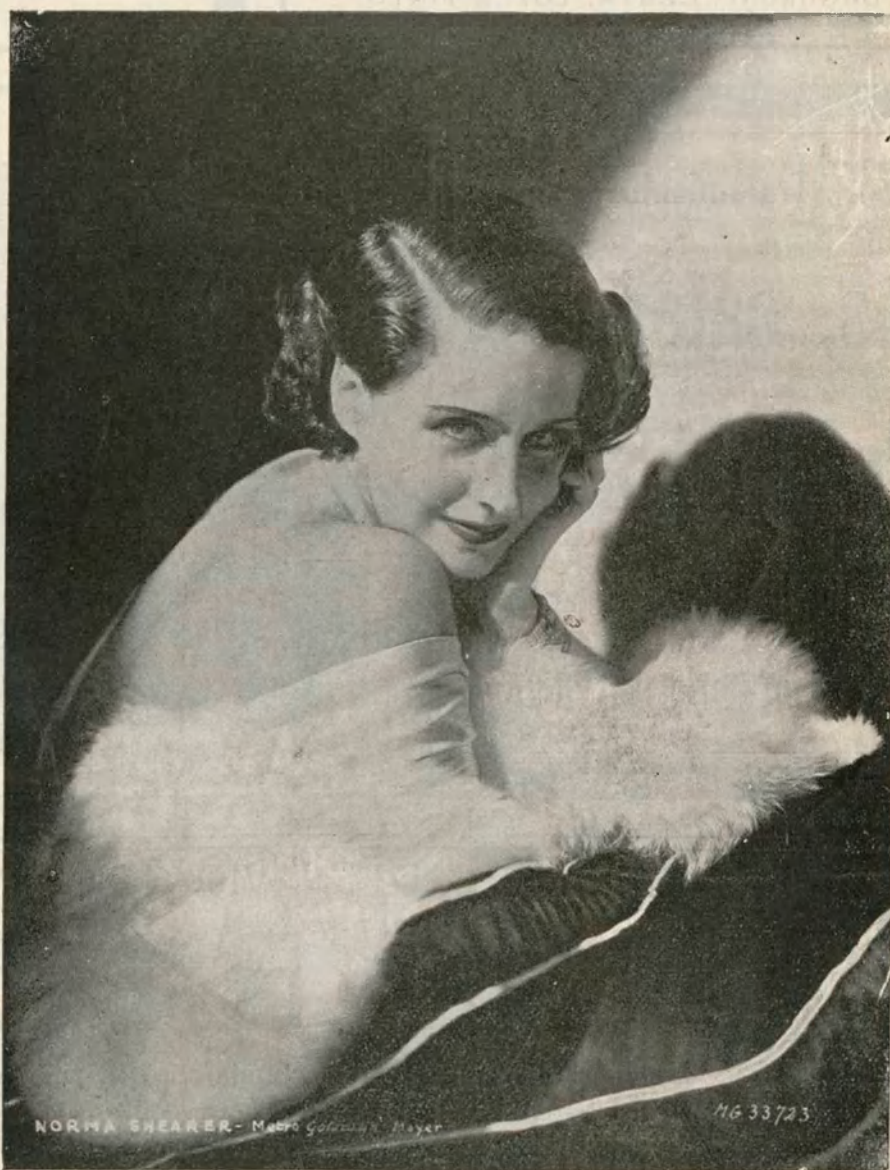
NORMA SHEARER - Metro Goldwyn Mayer