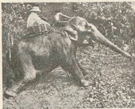
Otra escena de la formidable película «Malaca» que distribuye CIFESA

«Yo te doy mi corazón». Film inspirado en la vida de la célebre Dubarry, protagonizado por la incomparable Gitta