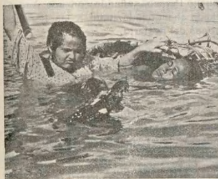
Un aspecto de la interesantísima película «Malaca» que distribuye CIFESA