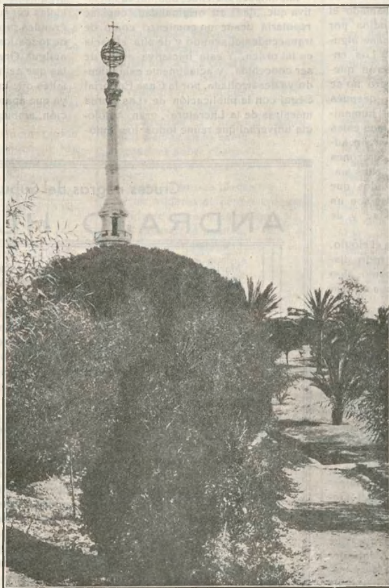
Junto al convento de la Rabida—la Covadonga de la Raza—se eleva este sencillo monumento que habla a los mundos de la gesta más grande que pueda conocer la Historia

Es que España, en realidad, no se fué nunca. Quien conoció al paisano de la campiña rioplatense, quien apreció los esenciales valores del verdadero gaucho, sabe perfectamente que ese arquetipo de la franqueza, de la sinceridad, la caballerosidad, el valor, la hidalguía, la abnegación y el heroísmo no era sino el español trasplantado al nuevo mundo. Vimos, después, en los campos, hombres de todos los pueblos, pero jamás un inglés, un italiano, un alemán se convirtieron en gauchos. En cambio, el español se acriollaba con tal naturalidad y tal justeza que no se diferenciaba. Y muchos entre ellos llegaban a lo que