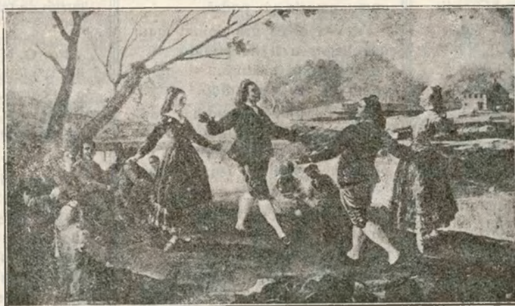
«La Jota». Tapiz de Goya que se conserva en el Museo del Prado

España está más ligada que nunca a Africa, y más apartada de América geográfica y espiritualmente. La cuestión económica la encuentra en Africa indudablemente, pero nunca en América, por la simple razón de que América concierne Tratados comerciales con España que perjudican nuestra economía muy seriamente. Y el mundo español no está para lirismos o recuerdos históricos. Aquello fué una ruina añorada románticamente y nublada por espejo trágico del