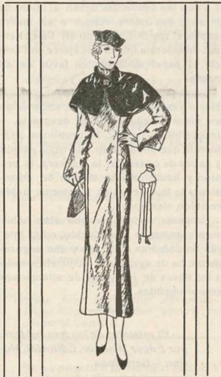
Elegante abrigo en lana roja. Como guarnición, cortes decorativos; cuello suelto de «sealskin»

que no reserve a los encajes puesto de honor. En un matrimonio, la madre de uno de los novios, a veces la abuela, o quizás la tía, llevan para la gran ocasión los encajes de otros tiempos, preciosos encajes cuidadosamente guardados entre papel de seda, no para conservar su frescura, puesto que su encanto es jus-