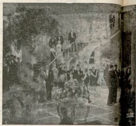
Un magnífico aspecto de la producción española «El Cura de Aldea» de Cifesa, que veremos el miércoles en Perelló