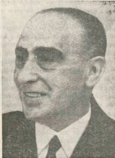
D. JOSÉ MARTÍNEZ DE VELASCO Ministro de Estado del Gobierno de la República

Mas hoy España, si quiere encontrarse a sí misma dentro del régimen que por su voluntad se ha dado, debe comenzar por definir claramente una gran política nacional alrededor de la cual girará forzosamente la otra, relativa, para con el resto del mundo. Y esta política no puede ser otra que la de procurar su libre dominio, sin extrañas presiones y mucho menos ocupaciones territoriales extranjeras en todo el área que abarca su extensión territorial, y zona de su Protectorado, esto es, desde los Pirineos hasta el límite norte del Marruecos francés; dominio que ha de exigir con más interés aún,