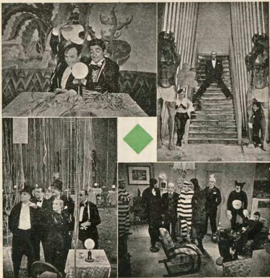
Cuatro momentos de la película española de Paco Elías «RATAPLAN» que presenta en la actual temporada la prestigiosa marca CIFESA.