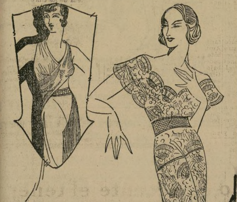
Bonitos vestidos para noche en organdi color pastel y batista bordada.

NEW YORK, marzo 28.—No se necesita ser un nigromante para predecir el retorno de los materiales de algodón. Ha vuelto, substituyendo los chiffones estampados para la tarde y noche en el verano. Ya les habíamos hablado antes de esto, pero no en detalle. Hoy he diseñado dos modelos muy lindos. El del grabado mayor es de batista bordada. El diseño es en rojo dando el efecto de encaje. En el corpiño y parte superior de la falda el bordado es más complicado, pero en la parte inferior no lo tiene. La figura de la esquima es de organdi azul en dos tonos, drapado. El corpiño cruzado termina en una sección de la falda.