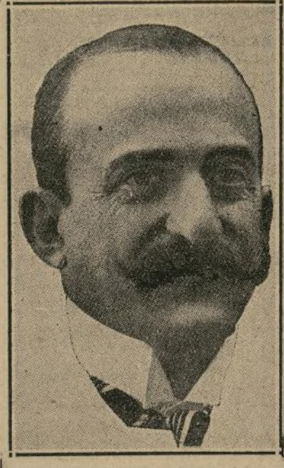
Conde de Romanones

La operación será interna, a 2 años de plazo y abonando 5% de interés.—El conde de Romanones dice que es infundado el temor a la reforma agraria