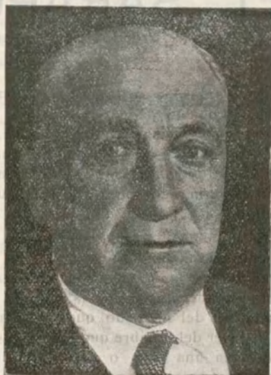
D. FRANCISCO LARGO CABALLERO

Hoy el panorama europeo ha cambiado totalmente. Sobre los campos de una guerra comercial ha crecido la hierba