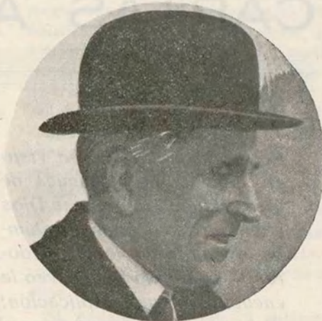
D. Manuel Portela Valladares Jefe del nuevo Gobierno de la República

para los Gobiernos de la hoya amazónica una dura lección de política colonial, dado el triste caso en que se hallan los indígenas de su cuenca y los instantes graves de sus relaciones exteriores, como, por ejemplo, el asunto de Leticia, el