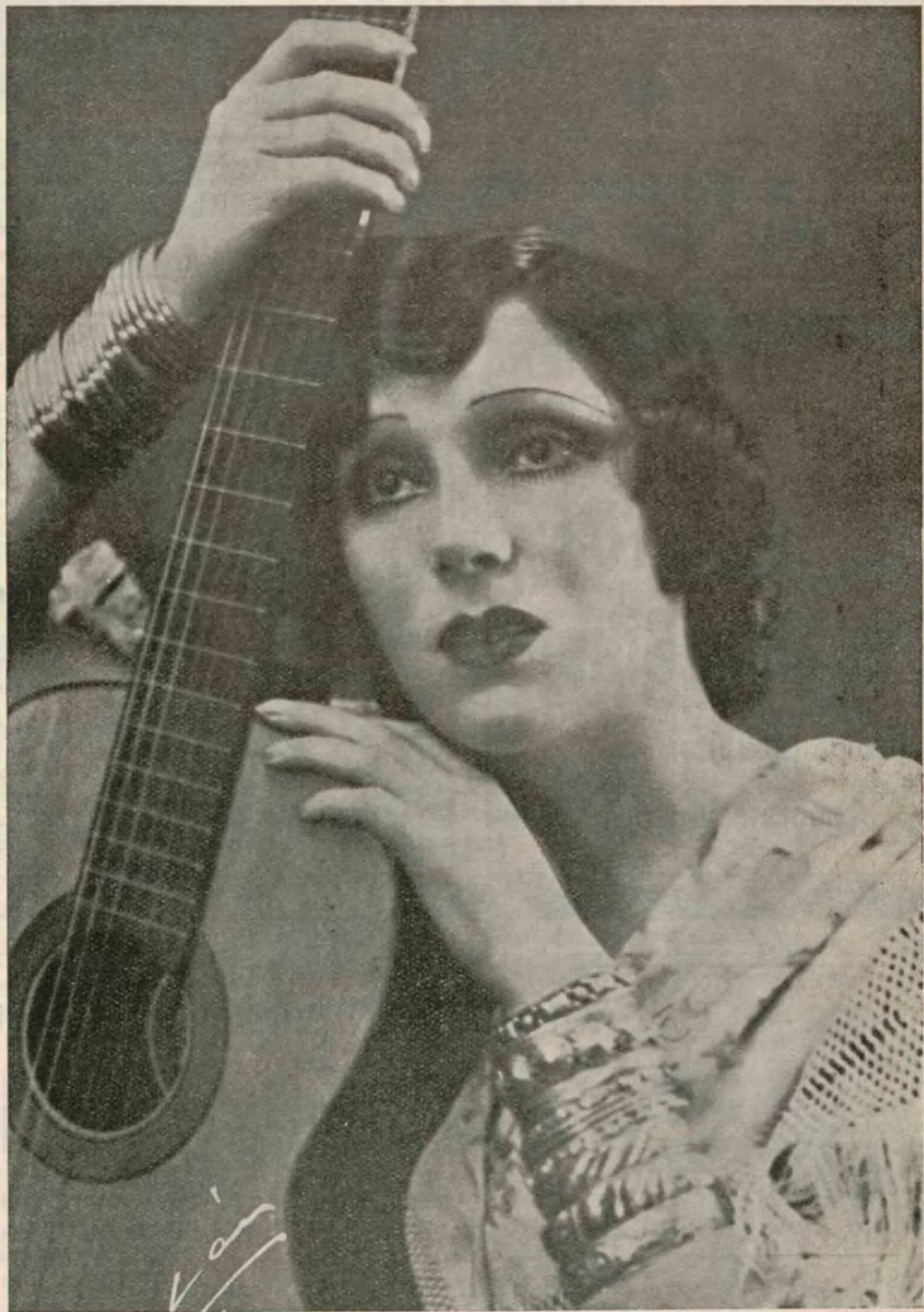
RAQUEL MELLER la exquisita artista cosmopolita por su arte y por su gracia que va a protagonizar "Santa Rogelia" para Cifesa