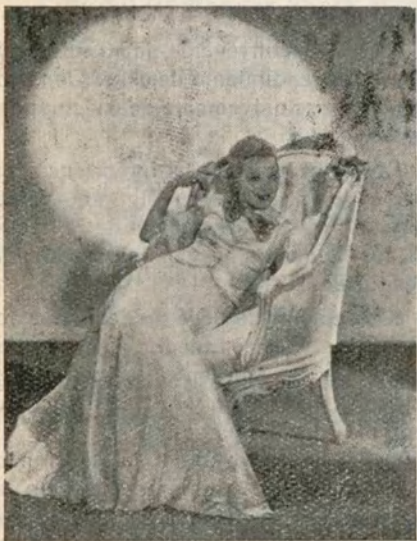
ASTRID ALLWYN, un nombre que veremos en varias producciones de la 20 th Century Fox

Cuando aun teníamos en los labios el temblor de la emoción y nuestro oído recogía los últimos arpegios de dramas y operetas aparece en esta pantalla una nueva producción de refinada gracia que