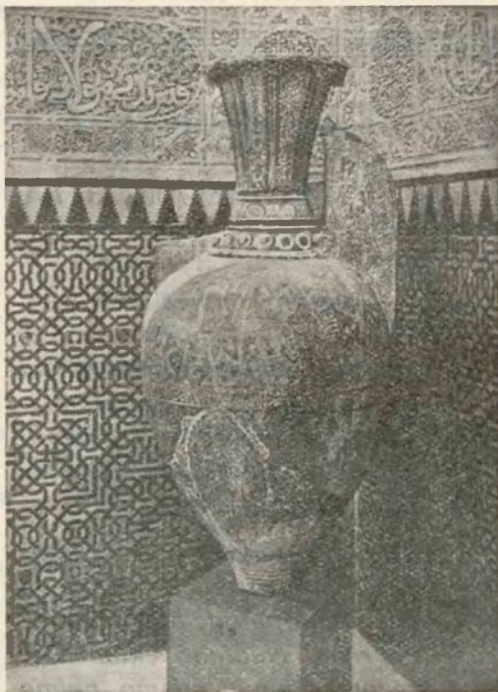
Jarrón árabe de la Alhambra

Ello no perturba nada el separar de la escuela francesa los jóvenes españoles nacidos en Marruecos y educados en un