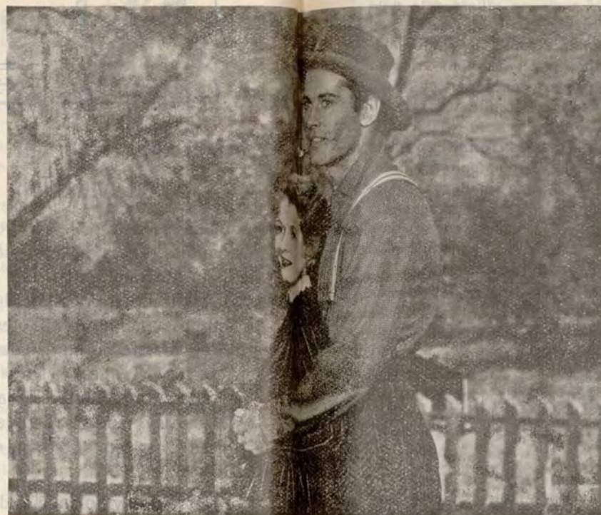
Janet Gaynor y Henry Fonda, protagonistas de «CONTRASTES», una producción Fox, reflejo de una época y sus caracteres

«Ahora bien; lo que yo no creo es que la política, la cual venga a desarrollarse para conseguir o efectuar, después de obtenidos, los fines stáquicos andaluces, (sean cuantas o cuales fueran las agrupaciones andalucistas que viniesen a servir como consecuencia inevitable de la existencia de criterios particularistas, en cuanto a los problemas que la evolución de la vida andaluza llegase a plantear); lo que yo no creo es que esa «Acción» política, tenga por fuerza que ser inspirada y dirigida prácticamente por los móviles y por los métodos o modos que usan los hoy denominados «Políticos prácticos u hombres de acción»; ni apercibidos tampoco la causa de que necesariamente para ser políticos, haya necesidad de incurrir en bajas avaluaciones a la muchedumbre ni en contactos deprimentes con gentezuela arribista. Hay que sustituir la política denominada de «Masas», por la ordenada; no a arrastrar, sino a mover libremente al individuo».