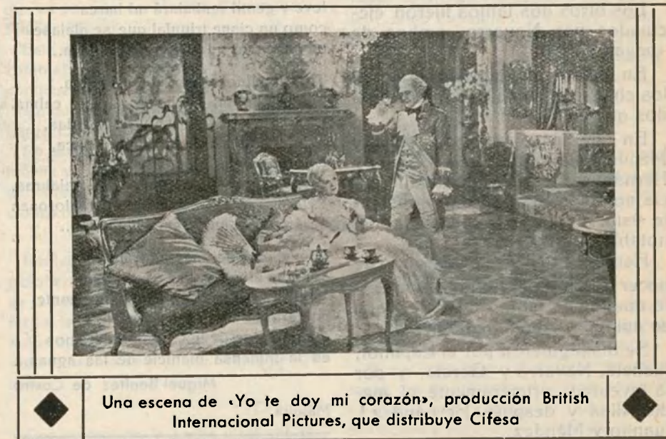
Una escena de «Yo te doy mi corazón», producción British Internacional Pictures, que distribuye Cifesa

Quinlan es natural de Cold Springs - on - te - Hudson, Nueva York, y se preparó para su carrera inventora con un grado de ingeniería de la Universidad de Columbia. Trabajó para una empresa de ingenieros en Nueva York y desde hace 20 años trabaja para la Fox.