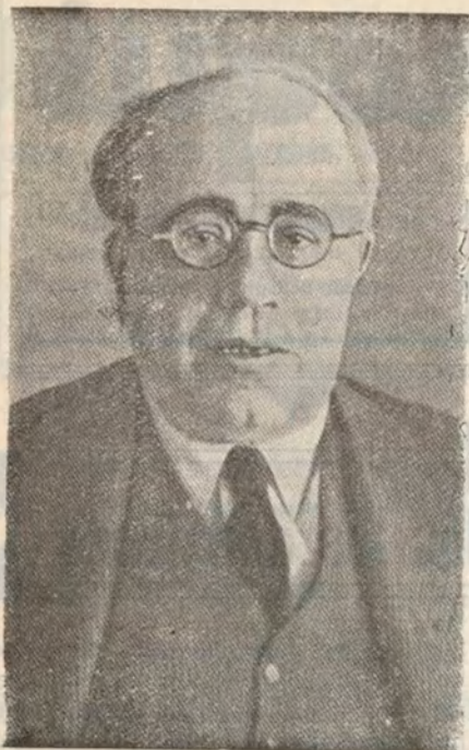
D. MANUEL AZAÑA Presidente del nuevo Gobierno