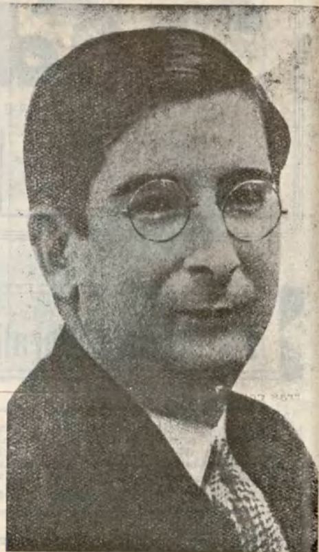
D. Marcelino Domingo Ministro de Instrucción Pública en el nuevo Gobierno