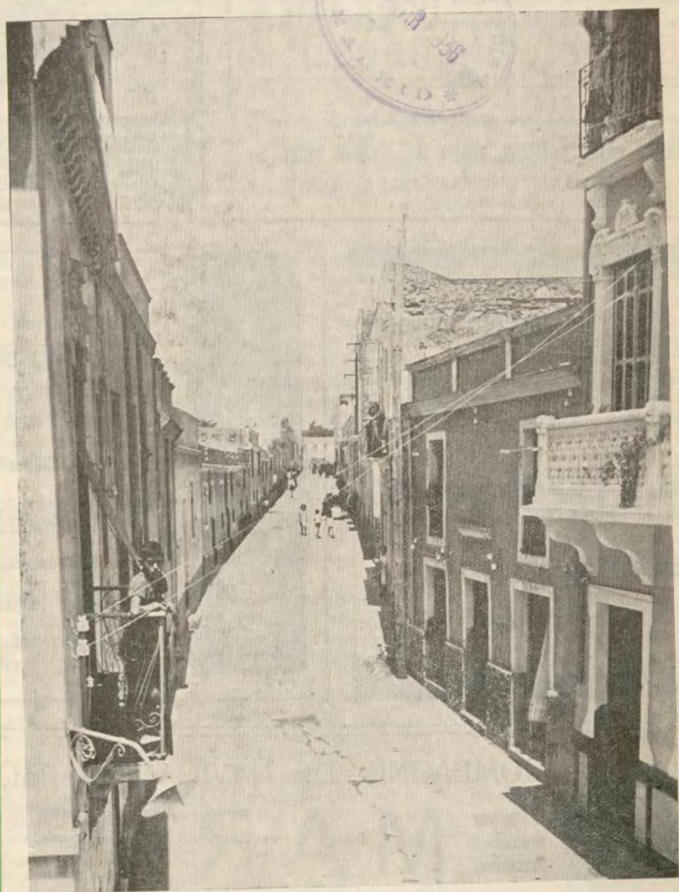
MELILLA: Un aspecto de la calle del Duque de la Torre, del barrio de Torrijos, que nos dá la sensación de calle principal de pueblo andaluz.