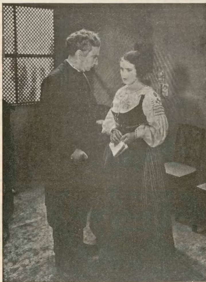
Uno de los momentos de la interesante producción ROMANCE PORTUGUÉS, de Cifesa