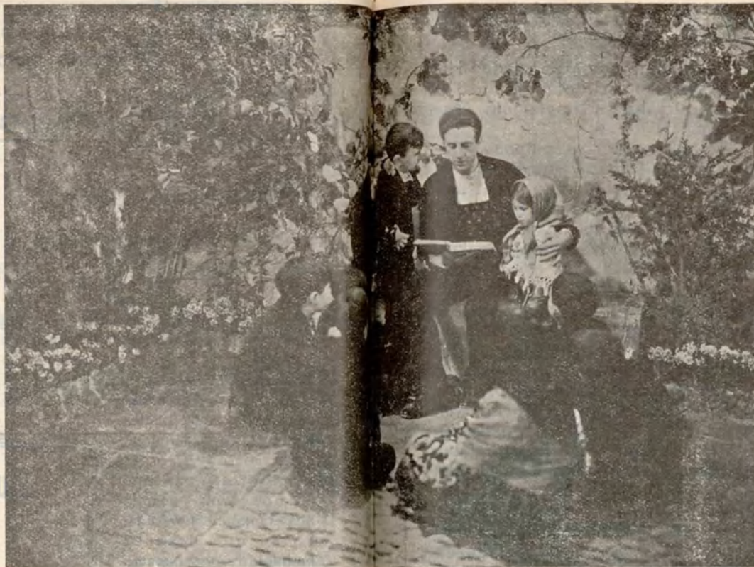
Juan de Orduña en una escena de la adaptación cinematográfica de la novela de Pérez Escrich EL CURA DE ALDEA que presentará próximamente la editora valenciana Cifesa

Una cárcel, en esta época, sin presos ni detenidos, es ya un motivo de estupor. Si a esto se le añade la seguridad de que a los reclusos