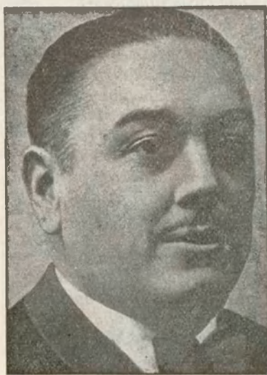
D. DIEGO MARTINEZ BARRIO

No eran menos las cualidades morales con que debían estar adornados los aspirantes a tan alta magistratura. Se distinguieron por su integridad, prenda de escrupulosa publicidad de sus actos