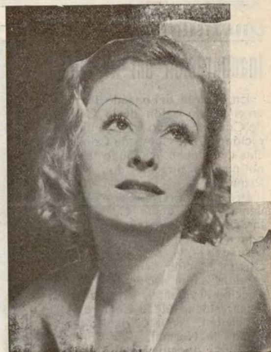
Lilian Harvey que actúa en el más importante «rol» de la película de Cifesa «La bailarina del conjunto» estrenada el pasado martes en el Perelló

«La nave de Satán» es un film lleno de intensa emoción, magníficas visiones del famoso infierno del Dante y en el que se encuentran acertados atisbos sociales. Su triunfo es muy justo y merecido.