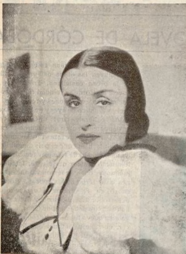
Titta Merello, protagonista de la producción argentina de Cifesa «Noches de Buenos Aires»