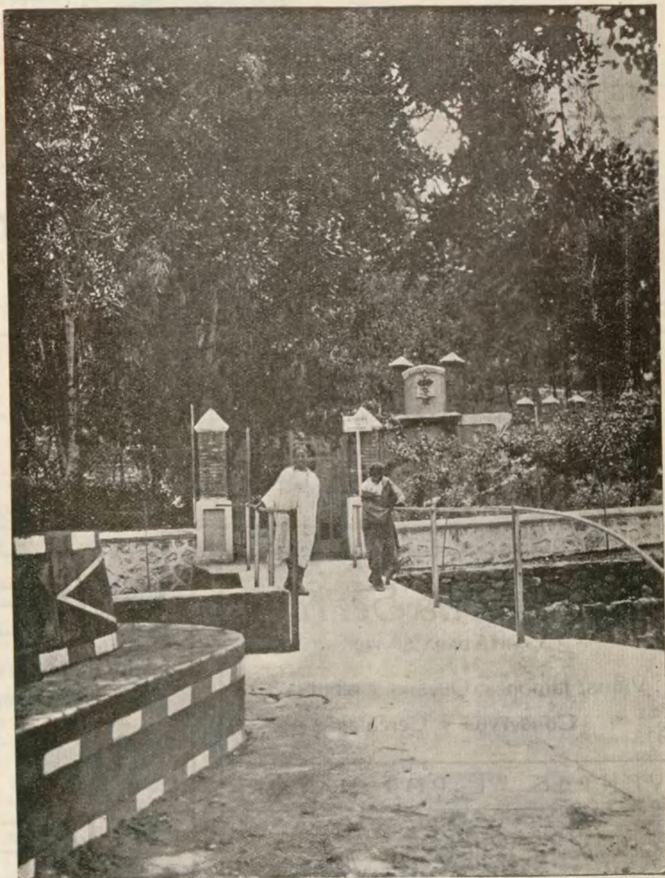
MELILLA: Un aspecto de Yasinén, después de las plantaciones efectuadas en dicho lugar de expansión y recreo de los melillenses