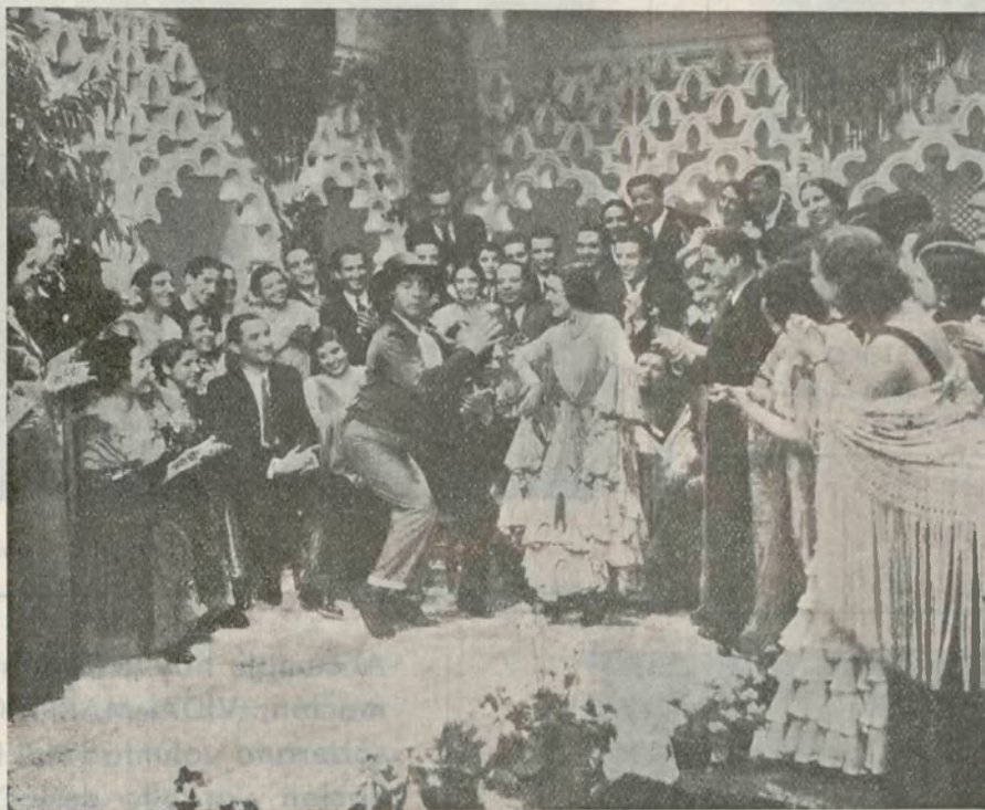
IMPERIO ARGENTINA y MIGUEL LIGERO en uno de los planos de la gran superproducción «Morena Clara» que próximamente será presentada por Cifesa