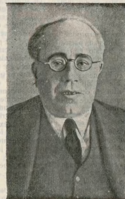
D. MANUEL AZAÑA Jefe del Gobierno de la República

Al cumplir hoy la República Española 1931 - 1936 el quinto aniversario de su proclama- ción, VIDA MARROQUI desea a dicho Régimen , establecido por la soberana voluntad del Pueblo, una vida honrosa, de aciertos y prosperidades, para bien de la nación y orgullo de los republicanos. Que por ello es una República Democrática de Traba- dores de toda clase, mantenida en régimen de Libertad y de Justicia