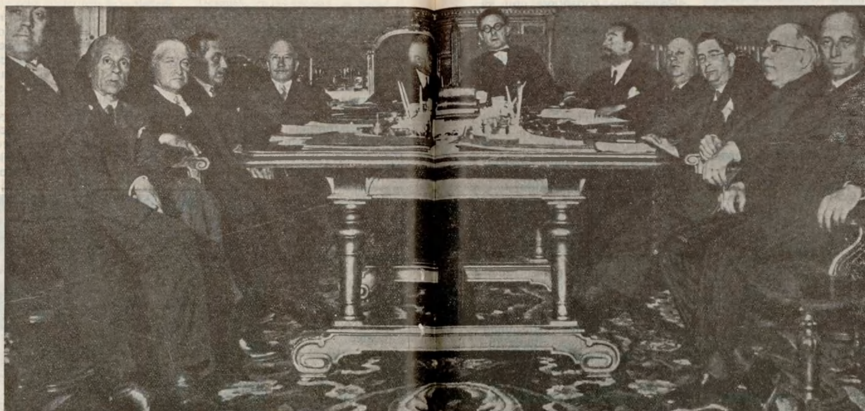
He aquí al Gobierno Provisional de la República, reunido en Consejo de Ministros. — Año de 1931