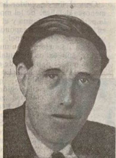
D. JULIÁN BESTEIRO Presidente que fué de las Cortes Constituyentes