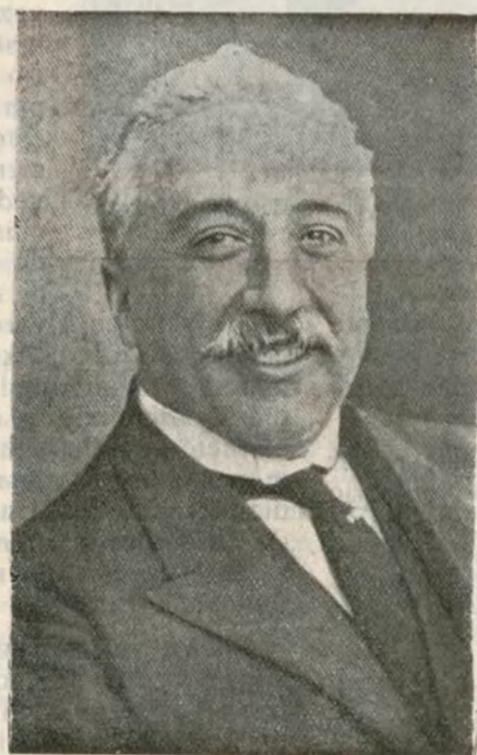
D. NICETO ALCALÁ ZAMORA Presidente del Gobierno Provisional y ex Presi- dente de la República Española

Al cumplir hoy la República Española 1931 - 1936 el quinto aniversario de su proclama- ción, VIDA MARROQUI desea a dicho Régimen , establecido por la soberana voluntad del Pueblo, una vida honrosa, de aciertos y prosperidades, para bien de la nación y orgullo de los republicanos. Que por ello es una República Democrática de Traba- dores de toda clase, mantenida en régimen de Libertad y de Justicia