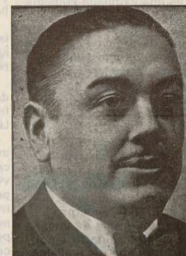
D. DIEGO MARTÍNEZ BARRIO Presidente del 3.º Parlamento y Presidente interino de la República