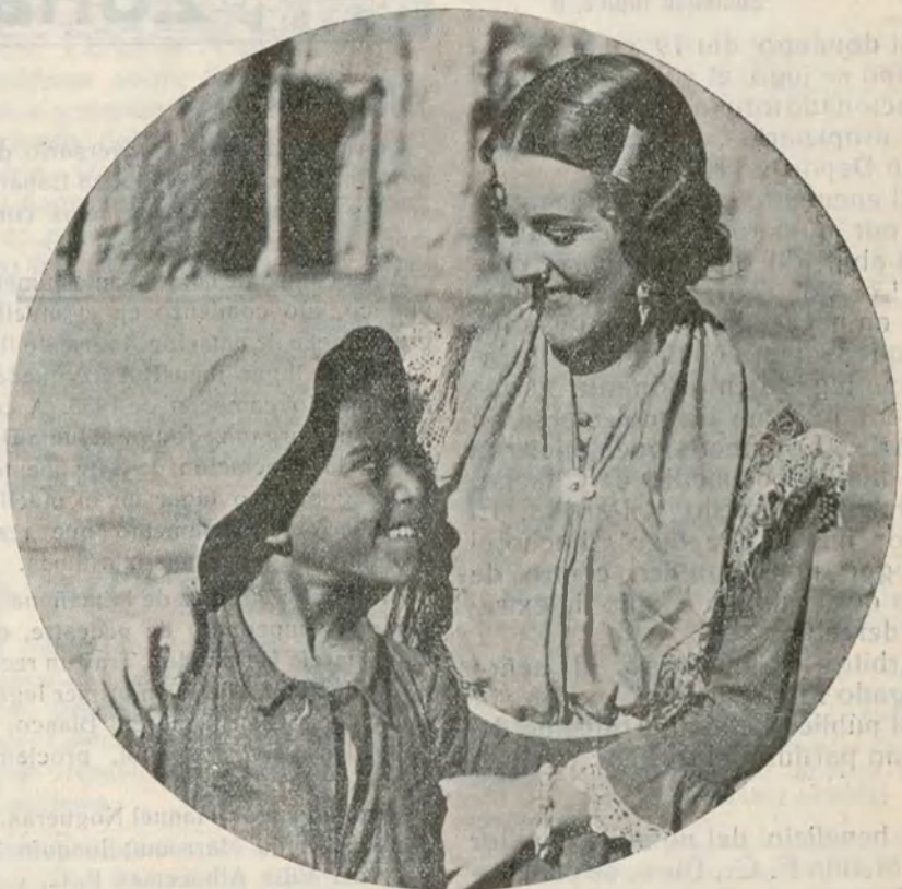
Un primer plano de Imperio Argentina en su última creación «Morena Clara»