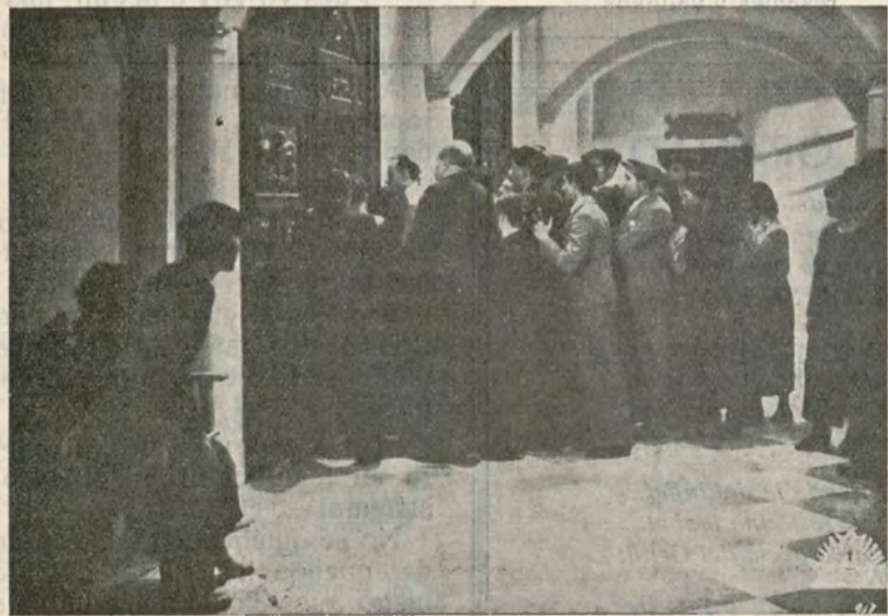
Una escena de la gran superproducción nacional «Morena Clara» editada por Cifesa y protagonizada por la genial estrella Imperio Argentina