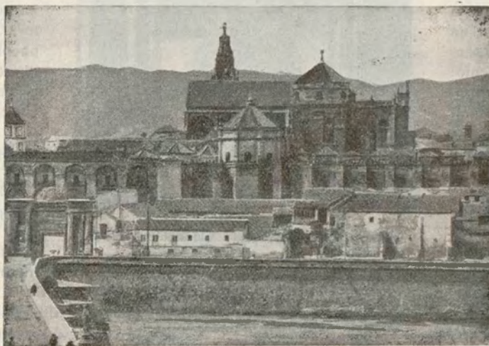
CORDOBA.— Conjunto de la Mezquita

Respetamos, pues, profundamente, la conciencia religiosa de los católicos; y