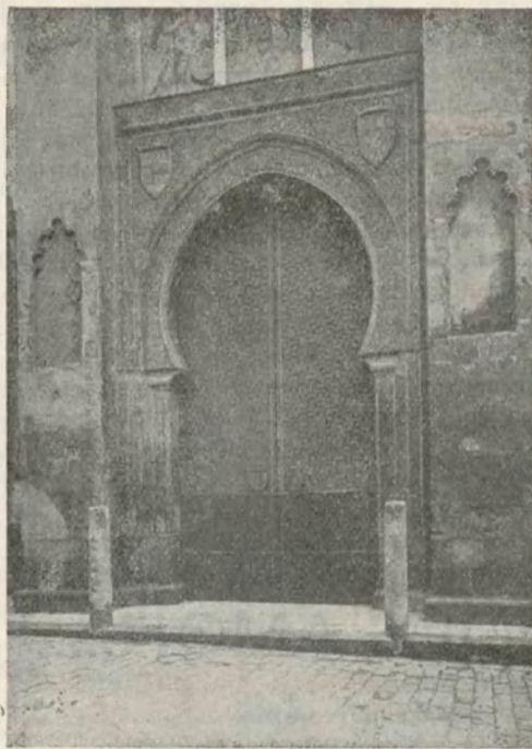
MEZQUITA CORDOBESA —Puerta del Perdón

sentados bajo los arcos de herradura de las puertas imperiales, cabe los alfeizares de los bakalitos, al pie de las altas murallas almenadas, en las Mezquitas y Oratorios, luciendo siempre los blancos e impecables sulhanes que estrenaron las Pascuas del Mulud en conmemoración del Profeta, o en las de Aid-Quebir y Aid-Seguir cuando van en cortejo a la Msala a sacrificar el carnero tradicional. Son siempre los mismos rostros sin transfiguraciones aparentes, sin exaltaciones manifiestas, sin prisas ni premuras, igual en sus grandes almacenes que