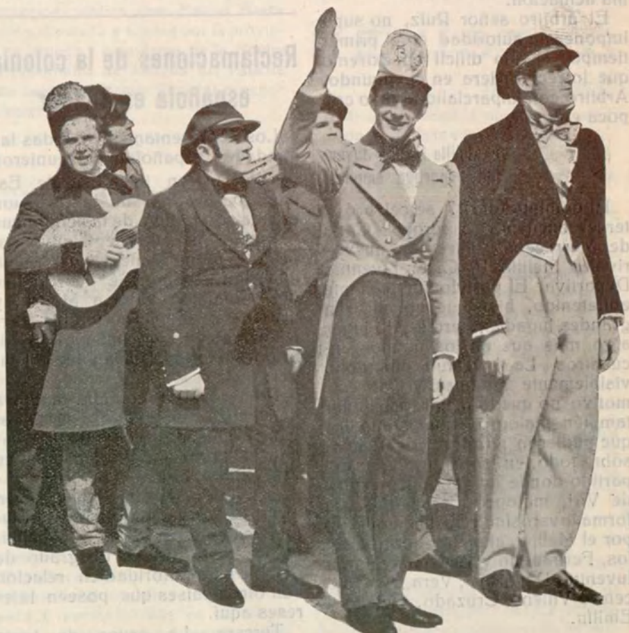
Una escena de ROMANCE DE ESTUDIANTES interesante producción inglesa, que presenta Cifesa