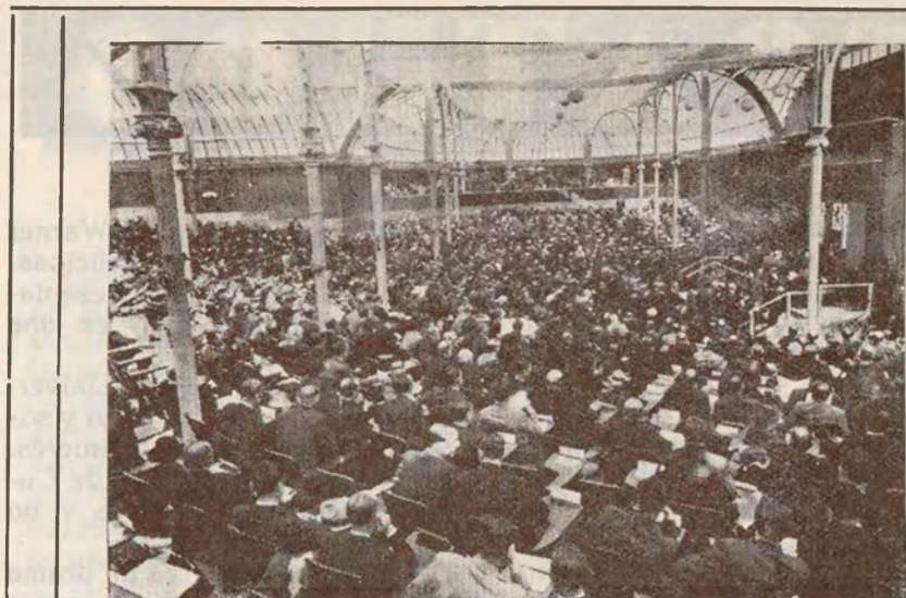
Vista del Palacio de la Exposición del Retiro, durante la elección de Presidente de la República.

Es proverbial la galantería con el sexo femenino, especialmente en tranvías y autobuses. En otros sitios del mundo hemos notado cierta remolonería en los hombres cuando se trata de cederle el asiento a una mujer. Aquí no. Y si la mu- jer lleva un niño en brazos, ya se sabe, es cosa automática: uno o más hombres se levantan para que ella se acomode.