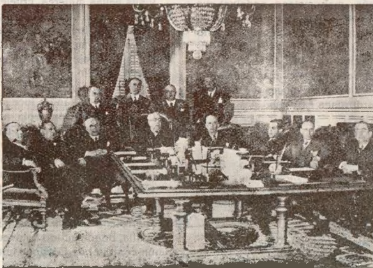
Ultimo Consejo de ministros presidido por D. Manuel Azaña