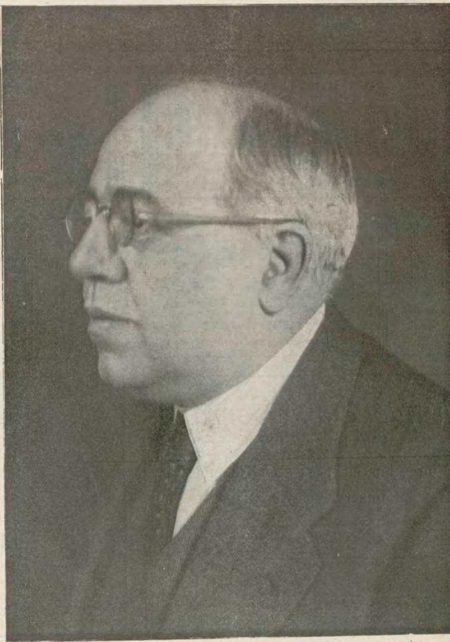
EXCMO. SR. D. MANUEL AZAÑA Y DÍAZ ◀ Nuevo Presidente de la República Española ▶