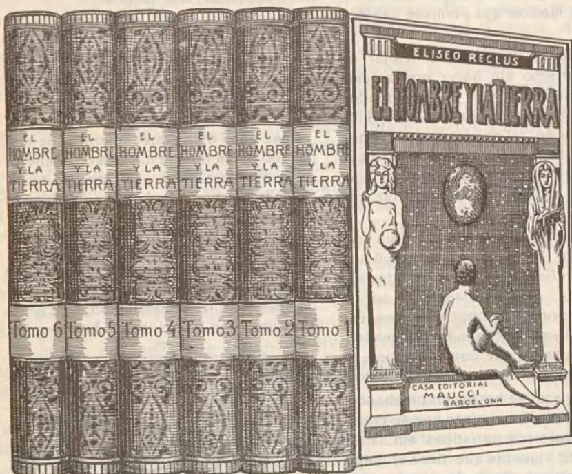
Tamaño 21 X 30

Con la lectura de esta obra, la más importante, clara y amena en su género, conocerá la Geografía e Historia social del Mundo desde sus orígenes, las costumbre de todos los pueblos en todas las épocas y el proceso filosófico de la Humanidad