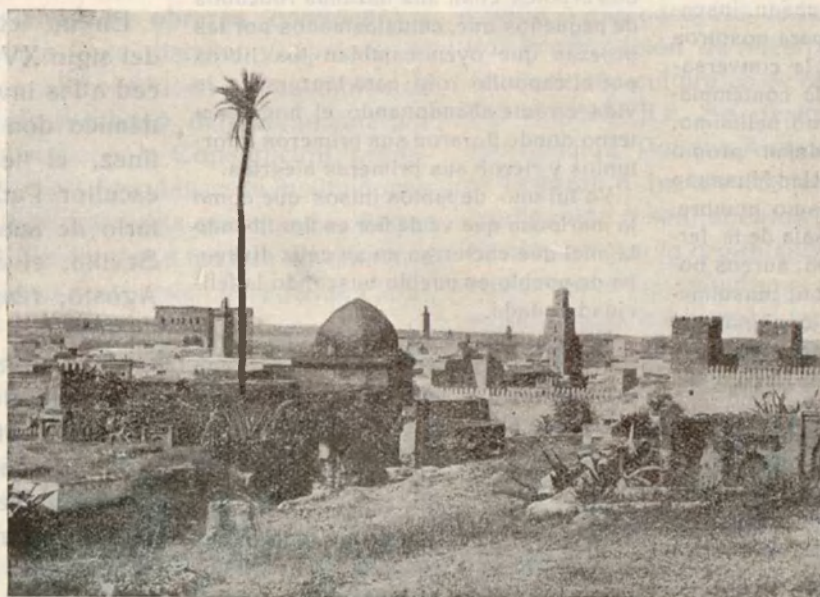
Vista general de Fez, desde el cementerio de los Sultanes Merinidas. Destacan en primer término las murallas de Bab-Dekakem y la Alcazaba Cherarda, próxima a Dar el Majzen o palacio del Sultán

carretera, dejando atrás kilómetros y más kilómetros, entre el verdor del paisaje, donde resaltan, como perlas, las gotas de la finísima lluvia, que el campo recibe como una bendición de los cielos.