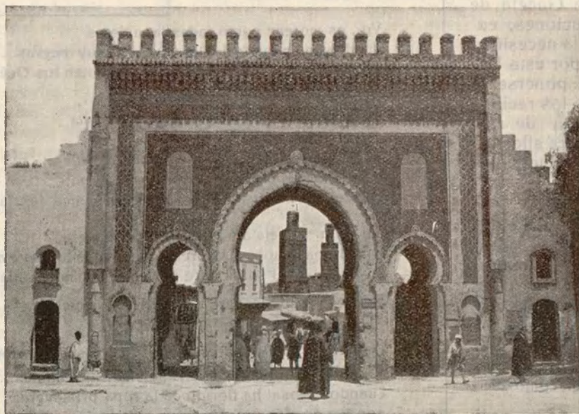
FEZ: Puerta de Bu-Jelud que sirve de entrada a la Medina, o Fez-el-Bali. Al fondo dos bellas y antiguas mezquitas

Esta calle principal del Mel-lah fási, que arranca de la misma Plaza del Co-