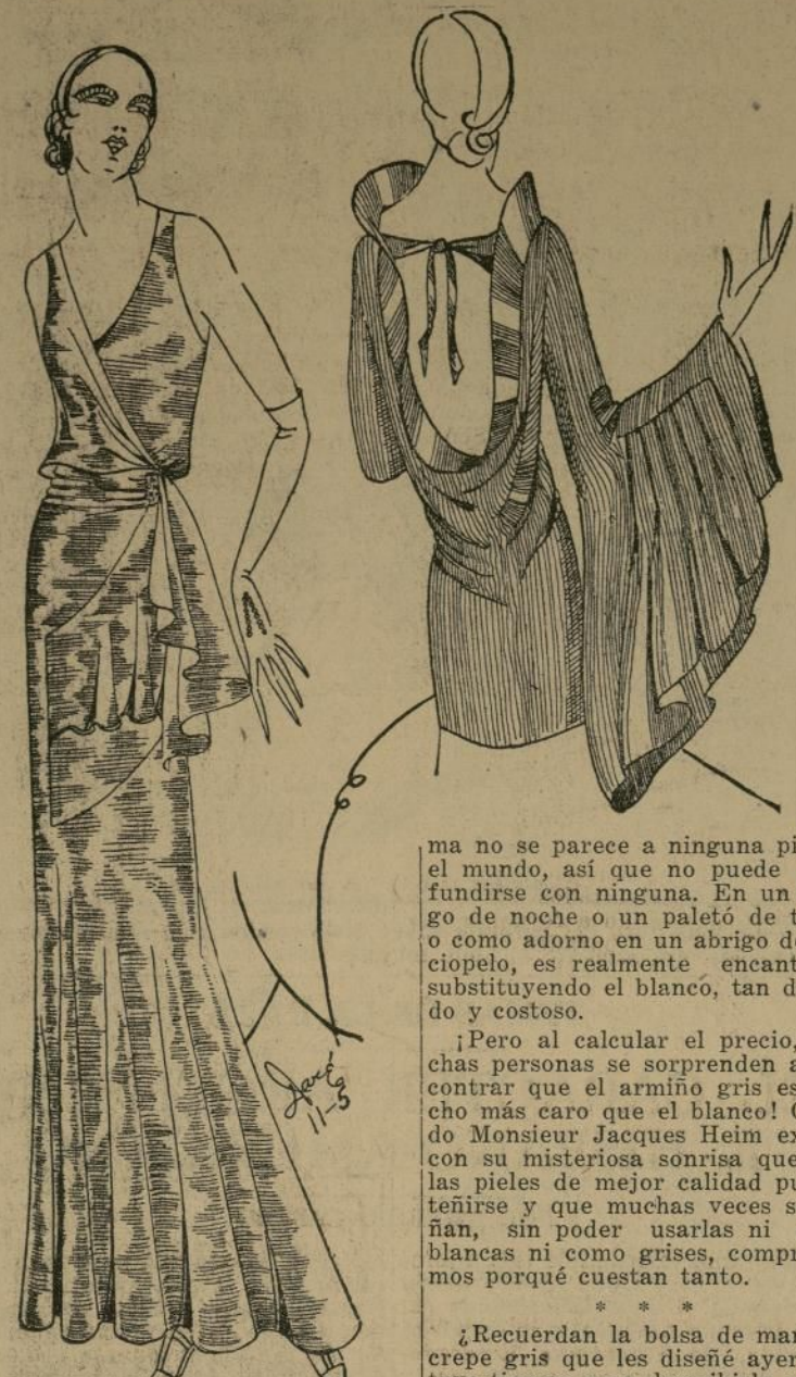
Encantador traje de noche, de lana verde plateada, acompañado de un saquito de terciopelo verde pálido

NEW YORK, octubre '31.—Heim, el famoso modisto-peletero de París es el que lógicamente tenía que introducir el armijo teñido de gris. El es el que ha creado todas las innovaciones en pieles durante los últimos treinta años, tales como el uso de pieles baratas para adornar abrigos de tela. Y más luego esta esa y no otra, empezó a introducir la moda de ajustar los abrigos de piel, moldeando con gracia la figura.