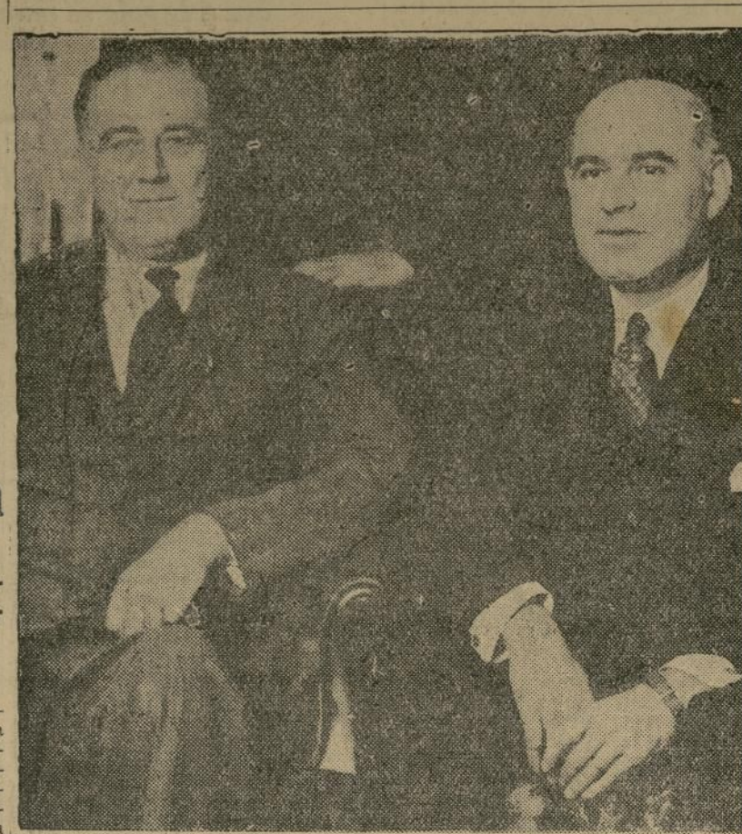
El Gobernador y el Teniente Gobernador, señores Franklin Roosevelt y Herbert Lehman, vencedores anoche por una gran mayoría sobre los candidatos rivales.