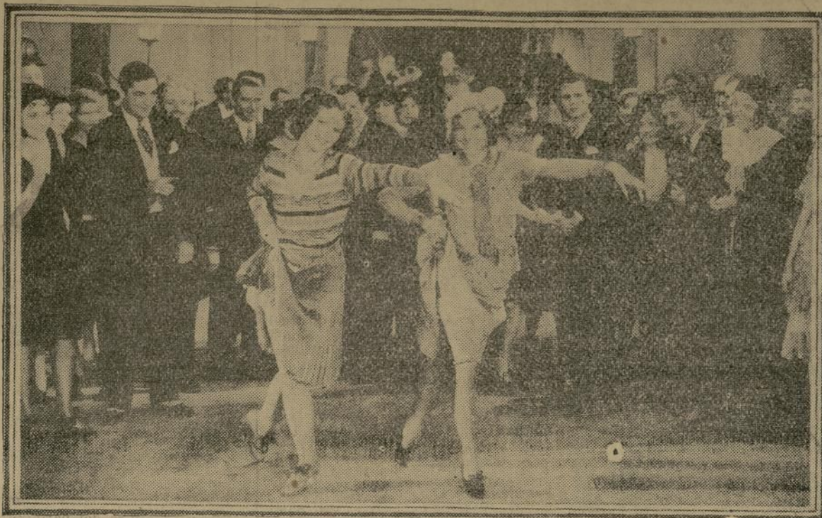
Una escena de "Primrose Path", la película que viene hoy al teatro "Gotham".

"El Valiente" en el San José. Esta película, versión española.