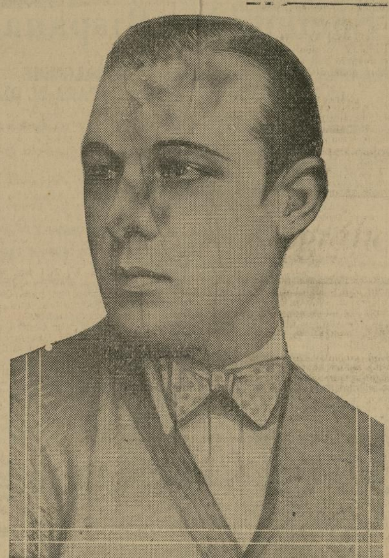
El celebradísimo y muy lamentado Rodolfo Valentino vuelve a sus admiradores mañana en "The Sheik", en el teatro "Regent".

pieza fue en Montevideo, el último verano y el éxito fue completo e inmediato por la variedad musical, belleza y destellos de risa irónica. El programa que se inicia con la sonata de Mozart, incluye "El Puerto" y "Córdoba", ambos de Albéniz, y la "Danza del Fuego" del "Amor Brujo" de De Falla, además de los "Soldados de Plomo" que como se sabe está inspirada en la "Marcha de los soldados de madera". El programa, como puede verse, es interesante y variado.