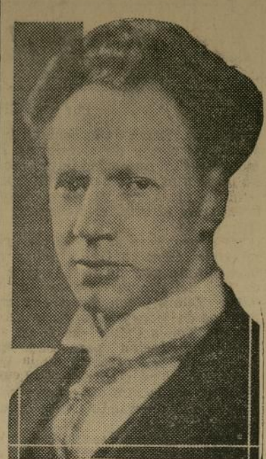
Ossi Gabrilowitsch, eminente pianista y reputado compositor, dirigirá el primer de tres conciertos de la Orquesta Sinfónica de Detroit que será radiada esta noche a las 10.00 por la estación WABC de la red Columbia Broadcasting System.

Bajo la dirección de Ossi Gabrilowitsch, afamado batuta y notable pianista de eminencia mundial, la Orquesta Sinfónica de Detroit, que durante la presente temporada dará por primera vez una serie de conciertos exclusivamente para el auditorio nacional de la Columbia Broadcasting System, dará principio a su programa esta noche a las 10.00, con una audición de una hora que será transmitida en la zona metropolitana por la estación WABC. Para la inauguración de este acontecimiento artístico en el mundo de la música combinada con el radio, el director Gabrilowitsch ha seleccionado un programa de méritos e interés inusitados y que será propulsado directamente del escenario de Orchestra Hall, en Detroit, donde el conjunto de ochenta y ocho profesores podrá indudablemente manifestar su notable competencia. Componen el programa las siguientes composiciones clásicas: