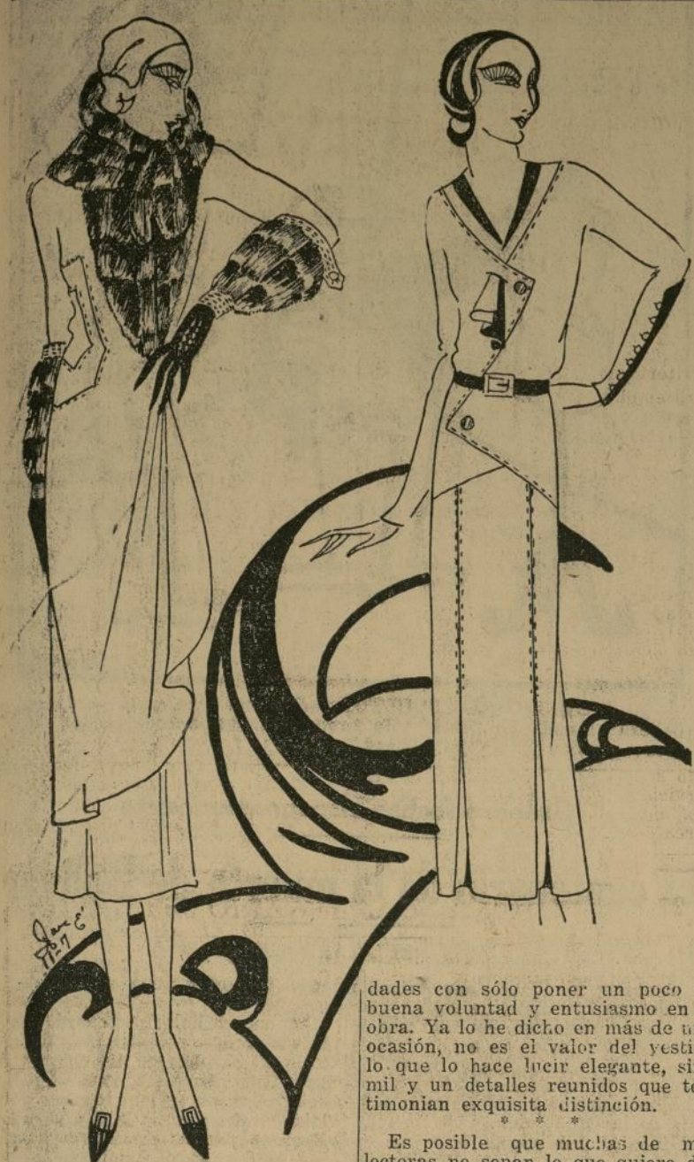
Precioso abrigo de tarde amarillito, adornado con piel de topo marrón.

NEW YORK, noviembre 3.—Escriban dándose ideas de algo que deseen aparecer en estas columnas. Si son cosas de interés general, las estudiaremos y si valen la pena, las tomaremos en consideración. No vayan a pedirme que les diseñe trajes para aprovechar retazos que tengan guardados o algo por el estilo, sino temas interesantes, útiles para la mujer en todos sentidos.