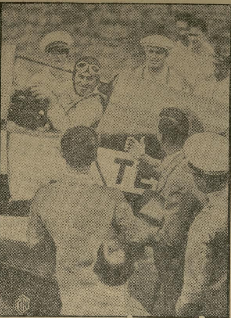
El capitán Frank M. Hawks, famoso aviador de velocidad americano, que acaba de volar de Nueva York a la Habana en un tiempo record, saludado entusiásticamente en el aeropuerto General Machado, a su llegada a la capital habanera.