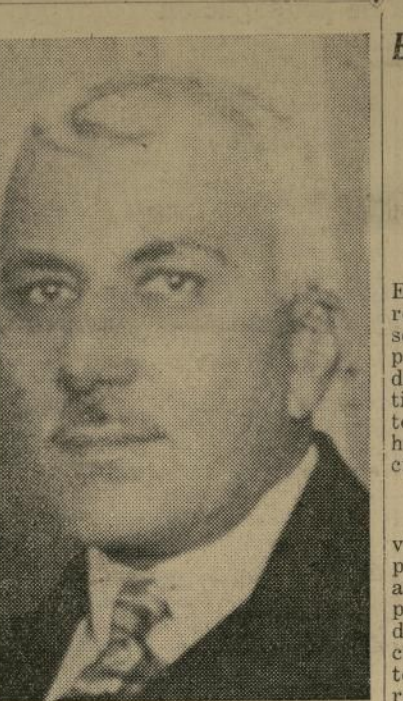
Coronel José R. Barceló, gobernador civil de Oriente, Cuba

El primero de los departamentos por reorganizarse será el del procurador general con más de cien