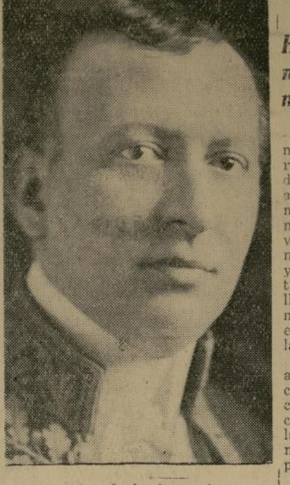
Embajador de la Argentina en los Estados Unidos

Fué recibido con honores el doctor Manuel Malbrán