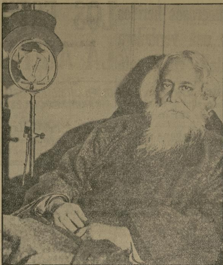
Sir Rabindranath Tagore, poeta laureado y famoso educador y filósofo de la India, fotografiado ante el micrófono antes de empezar su primera transmisión por radio. Habló desde sus habitaciones sobre el tema: "La juventud reconstruyendo al mundo."