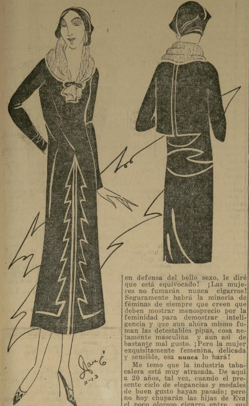
Original traje de calle de lana marrón con cuello de "peluche" beige

NEW YORK, noviembre 8.—¿Qué hubo? El director de la "French Tobacco Monopoly" está convencido de que las mujeres fumarán cigarrillos. Y con esta idea ha mandado fabricar unos diminutos cigarrillos que serán llamados poco más o menos "Pequeña Mujer", usando la primera mitad de la frase en francés y la otra en español. Hace algunos años sonreímos incrédulos cuando se nos dijo que en Copenhague, capital de Dinamarca, las mujeres fumaban puros en público y las consideramos como criaturas sejanas a nosotros. Ahora que las mujeres fuman cigarrillos en casi toda Francia y en el mundo entero, los fabricantes de cigarrillos no dudan que puedan inducirlos a saborear estos cigarrillos, basándose en que ellas prefieren una buena mezcla de tabaco a los cigarrillos perfumados, con monogramas y ribetes dorados. [Pues bien, Monsieur Blondeau,