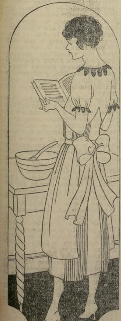
Al preparar un manjar, deben usarse los ingredientes apropiados.

El adagio que dice "querer es poder" es muy digno de tenerlo en consideración. Toda regla tiene su excepción, es verdad, pero cuando ponemos nuestro mejor empeño y sinceridad en las tareas que emprendemos, sean de orden empi-