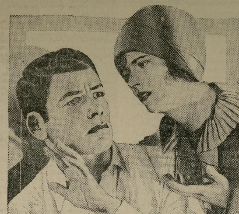
Una escena de la cinta hablada en español "El Valiente", que se exhibirá en el "Regun" en la medianoche del sábado.