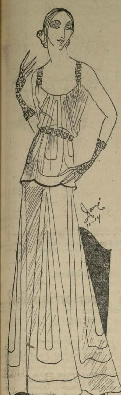
Precioso modelo para noche, celeste pálido, adornado con "strass".