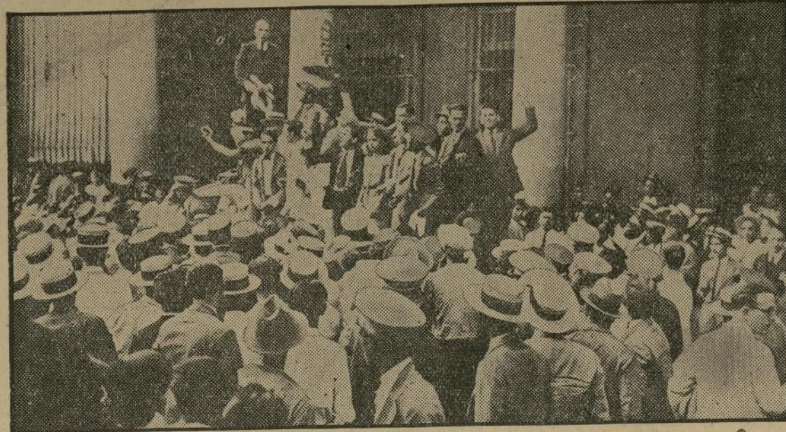
Estudiantes de la Universidad de la Habana arengando a la multitud frente al edificio de un diario al comienzo de los sucesos que provocaron la proclamación de la ley marcial y causaron siete muertos y unos cincuenta heridos.