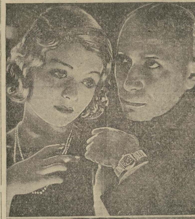
Constance Bennett y Eric Von Stroheim, en una escena de "Three Faces East", que empieza a proyectarse esta noche sobre el lienzo del "Mt. Morris".