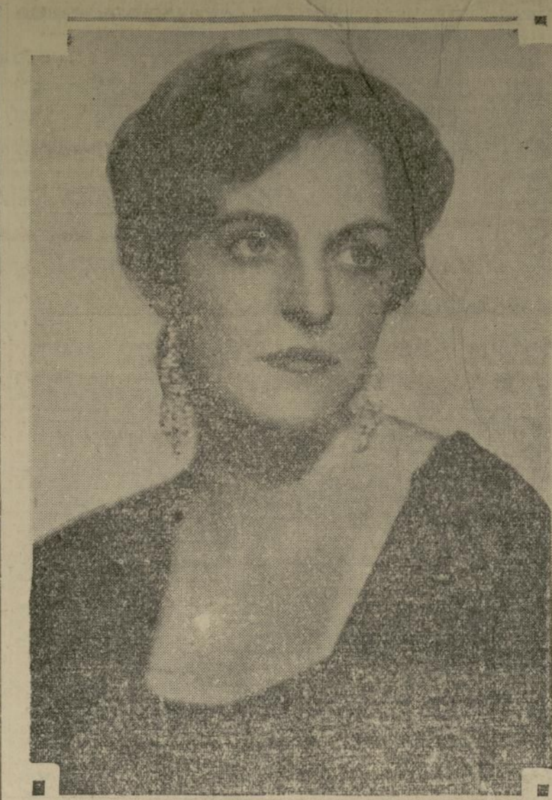
He'len Gahagan hace su "réntre" en el teatro "Belasco" de esta ciudad como primera actriz de "Tonight or Never," nueva producción de David Belasco.

Y aquí viene una revelación que dejará al público atónito.