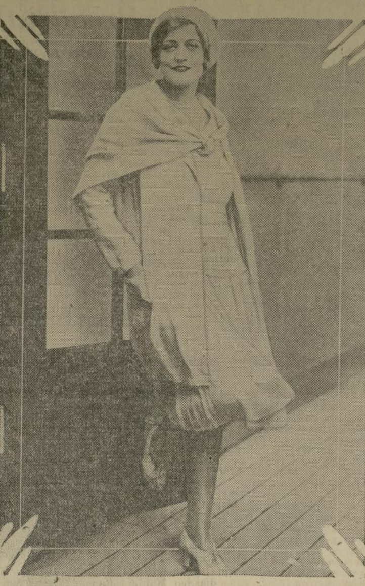
Mildred Hunter, afamada tonadillera contrato de la compañía National Broadcasting Company, conocida por miles de radio-escuchas como "la favorita del radio", acaba de regresar de Londres, adonde fue contratada para demostrar el nuevo estilo de tonada yanqui, y en lo cual logró un resonante éxito.