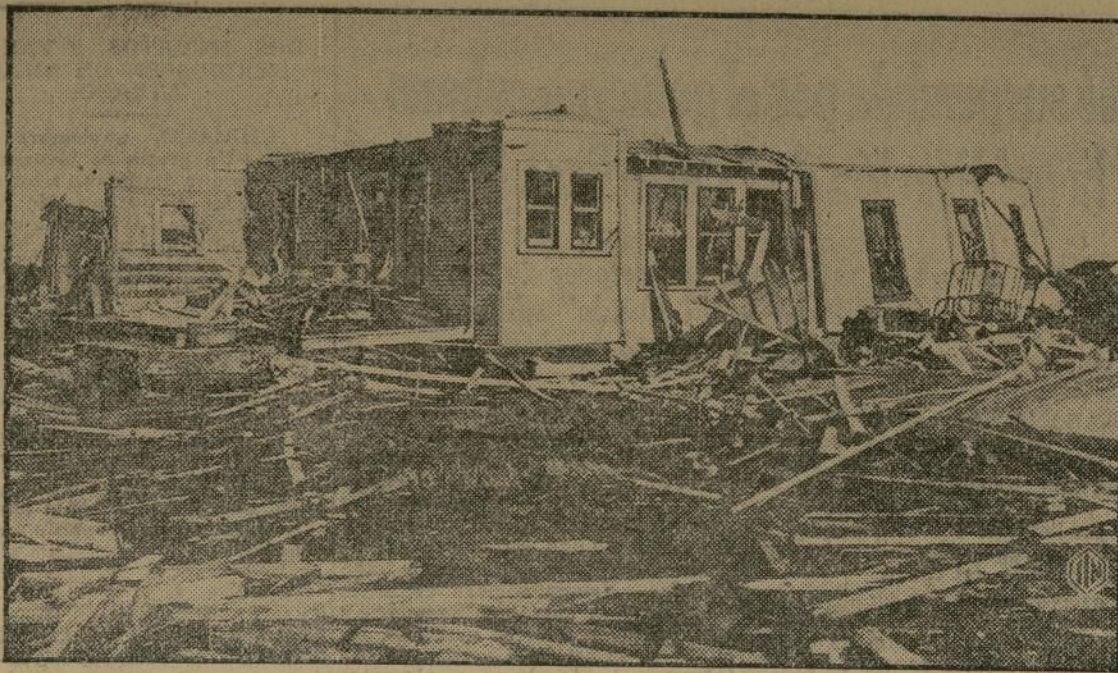
Una vista que ilustra claramente los destrozos que causó el reciente tornado en Oklahoma, que además de costar la vida a 19 personas, causó pérdidas a muchísimas y produjo daños inmensos.