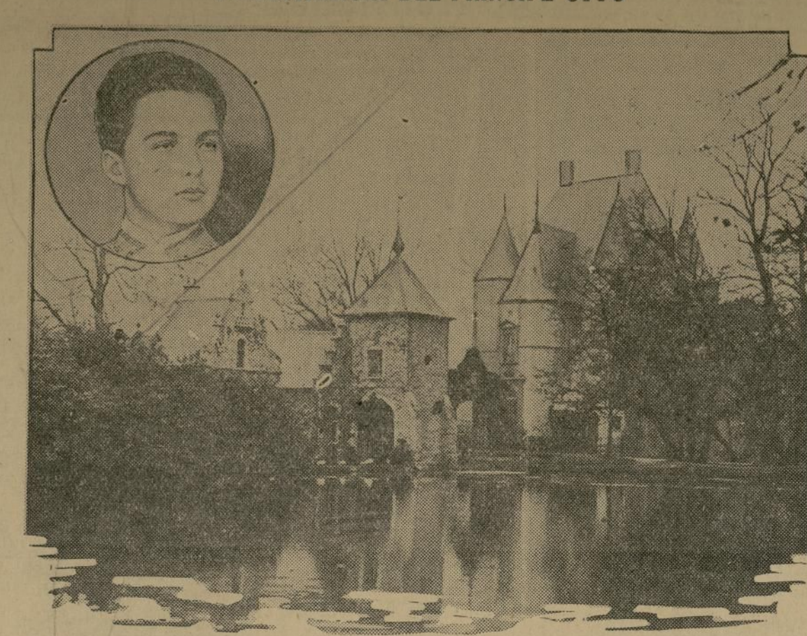
Vista del hermoso castillo de Steenokkezeel, en Bélgica, propiedad del marqués de la Croix, y en el cual reside el archiduque Otto, que acaba de cumplir 18 años de edad y de ser proclamado “rey” de Hungría por su familia y sus partidarios. En el círculo un reciente retrato del joven príncipe.