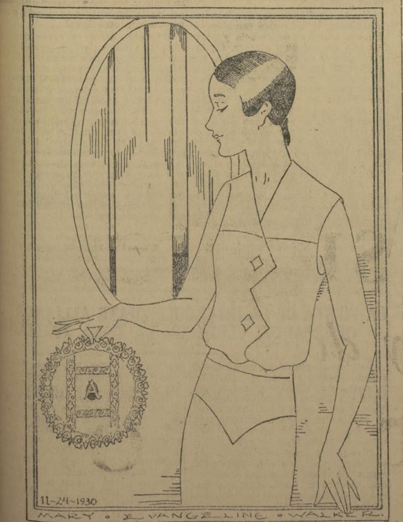
La inicial se coloca en el centro del "doily."

Una manera más sencilla de hacer estos "doilies" es cortar cada