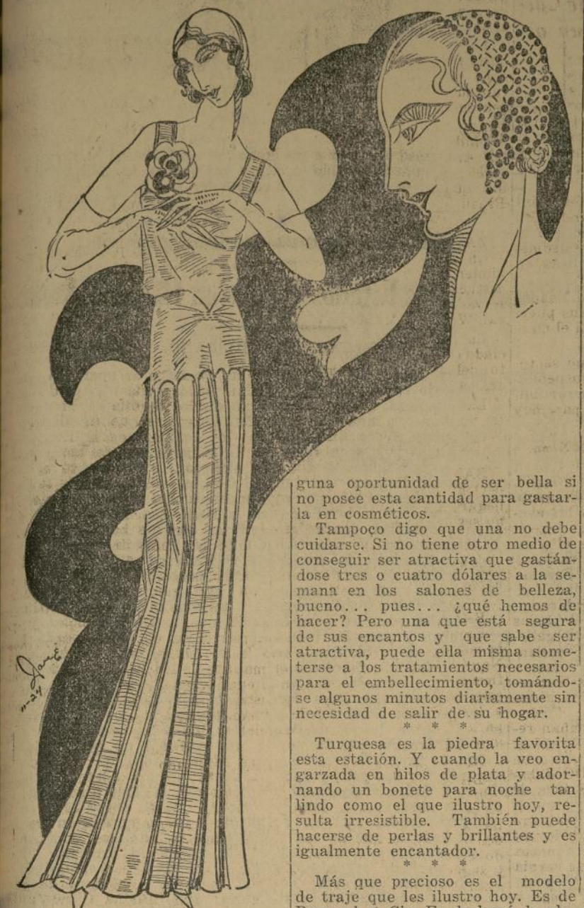
Precioso modelo de talle de plata, con flor en el hombro de terciopelo turquesa.

NEW YORK, noviembre 19.—El ilustrado congreso de belleza americana ha decretado que el gusto mínimo para artículos de belleza es de $3.00 a la semana. Muchas mujeres pensarán que esto es demasiado poco, mientras que con un promedio de dos dólares a la semana pueden adquirir cuanto necesitan.