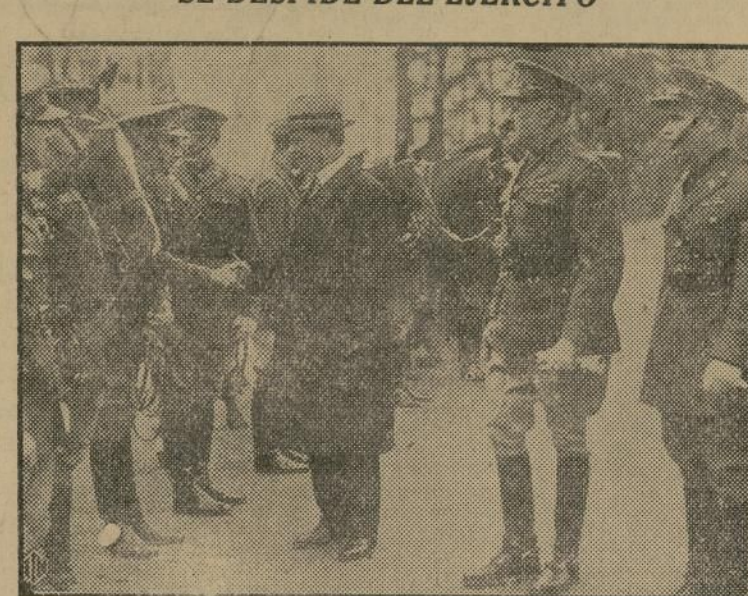
El general Charles P. Summerall, jefe supremo del ejército de Estados Unidos, que se retira del alto cargo y con ese motivo hubo una revista de tropas en Fort Meyer, Virginia, para despedir a su jefe. En el grabado se ve al general estrechando la mano a varios de sus oficiales.