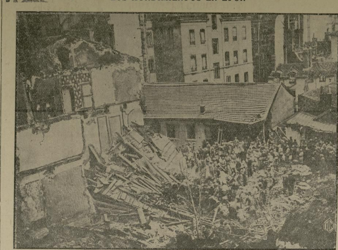
Una vista parcial del hundimiento de la colina Fourvière en Lyon (Francia) ocurrido hace pocos días y que costó la vida a un centenar de personas aproximadamente, además de elevados daños materiales y gran cantidad de heridos.