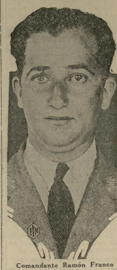
Comandante Ramón Franco

En la reunión consular iberoamericana del mes se habló del desempleo