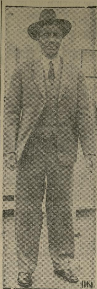
Coronel Theodore Roosevelt, gobernador de Puerto Rico

Gestionará la extensión de leyes federales a dicha isla.—Pronunciará discursos pro-niñez indigente y el sostenimiento de comedores escolares.—Córdova Dávila impulsará la ley de educación vocacional ante el congreso.