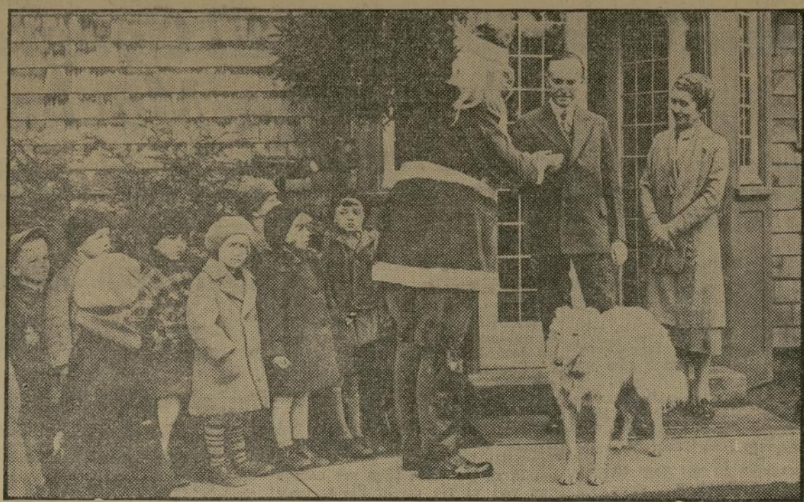
El ex presidente de Estados Unidos, Mr. Coolidge y su gentil esposa, fotografiados a la puerta de su residencia en Northampton, Mass., comprando los primeros sellos de Navidad que se vendieron en aquella ciudad, y cuyo producto se destina a combatir la tuberculosis.

LOS ESPOSOS COOLIDGE COMPRAN SELLOS DE NAVIDAD