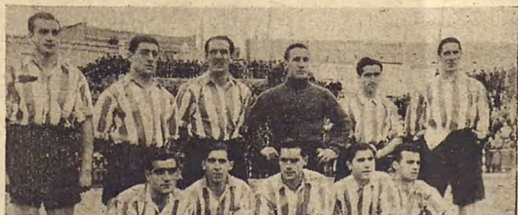
Athletic de Bilbao.