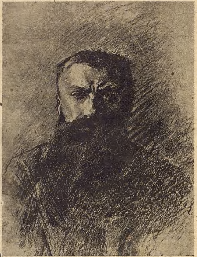
Autoretrato de Rodin.

El escultor conoció en aquellos años la obvia necesidad de abandonar los en-