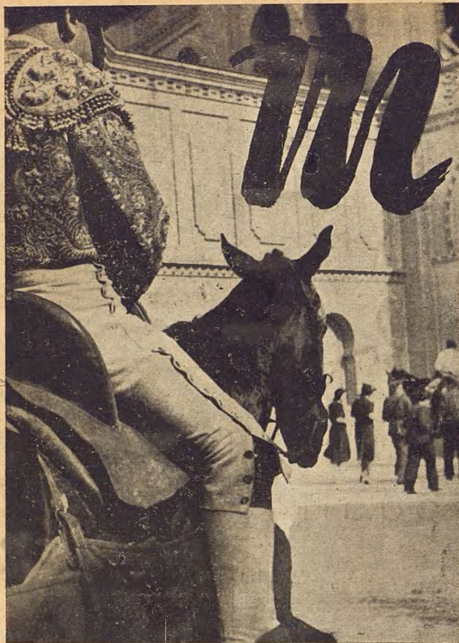
La gente reía con los torpes y raros movimientos que hacía el viejo animal al oír la música, sin sospechar la historia sentimental que significaba aquello.