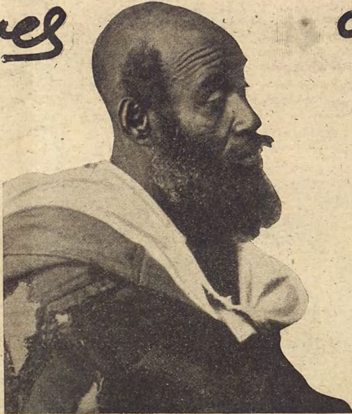
Un "aissana", fanático creyente de Sidni Ysa.

Cuentan los "eruditos" que en una de sus incesantes peregrinaciones el viejo morabo era seguido por una imponente multitud de adeptos, a través de las calientes arenas del desierto del Sus. Aquellas gentes, que esperaban con ansiedad las palabras del Santo, preñadas de revelaciones sobrenaturales, llevaban ya muchos días de duro caminar sobre el áspero suelo y bajo la tortura del