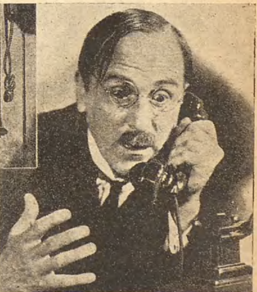
TELEFONO. Pedazo de hilo en cuya punta hay siempre un señor preguntando si nosotros somos la carbonería.