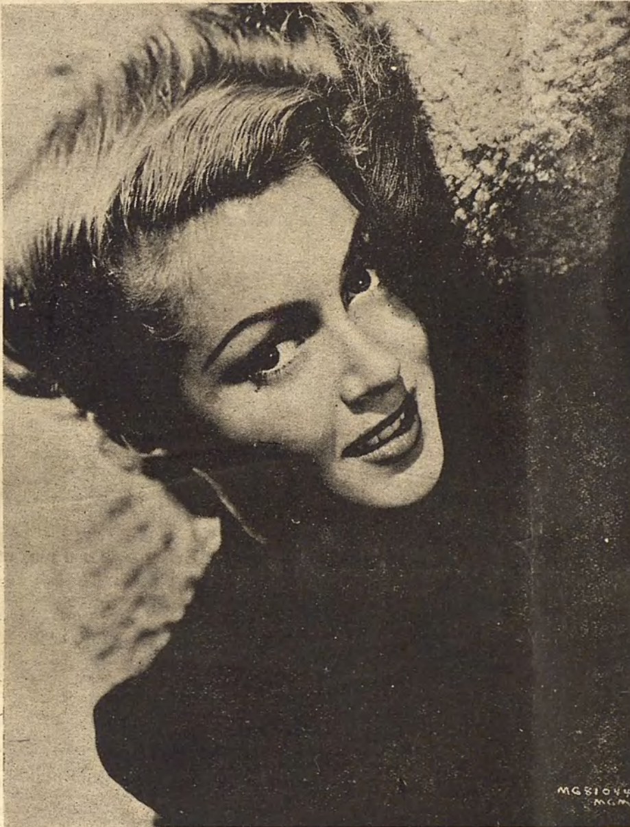
Lana Turner, una de las nuevas figuras lanzadas por Hollywood a la efímera celebridad del cine.

Pero la falsificación exige una técnica que no se encuentra en cualquier parte. Cuando los inexpertos quieren emular el desenfado de las gentes de Hollywood, inciden, no en un pecado de autenticidad, sino en algo más imperdonable: en un pecado de sensibilidad.