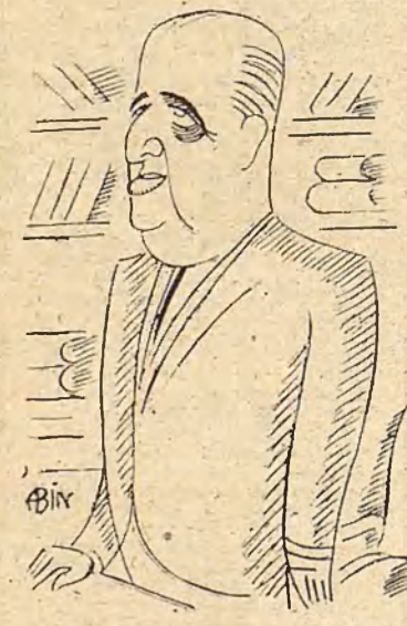
Cossio, por Abin.

Miguel Vegas: Geometría analítica (Suárez).—R. Gaus: Introducción al Análisis vectorial (Labor).—H. Folstein: Cinemática (Labor).—Francisco Pérez Pons: Contabilidad elemental (Bilbao).—Salinas Benítez: Aritmética (Hernando).—J. Bermejo Rodríguez: Nociones de Aritmética (Rubinos).