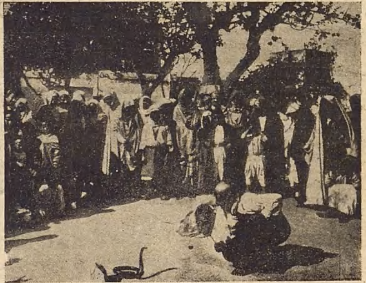
El "effaj"—la cobra capello—se empuña amenazante, pero el "aissana" acaba fascinándola.

Aun realizan los "aissanas" otra más tremenda experiencia. Cogen dos "effaj"—los más venenosos reptiles del desierto del Sus, cuyas víctimas mueren en medio de atroces convulsiones, porque su mordedura incendia la sangre con un fuego espantoso—, y cuando éstos se arrojan contra el cofrade de Sidni Ysa con las mandíbulas abiertas,