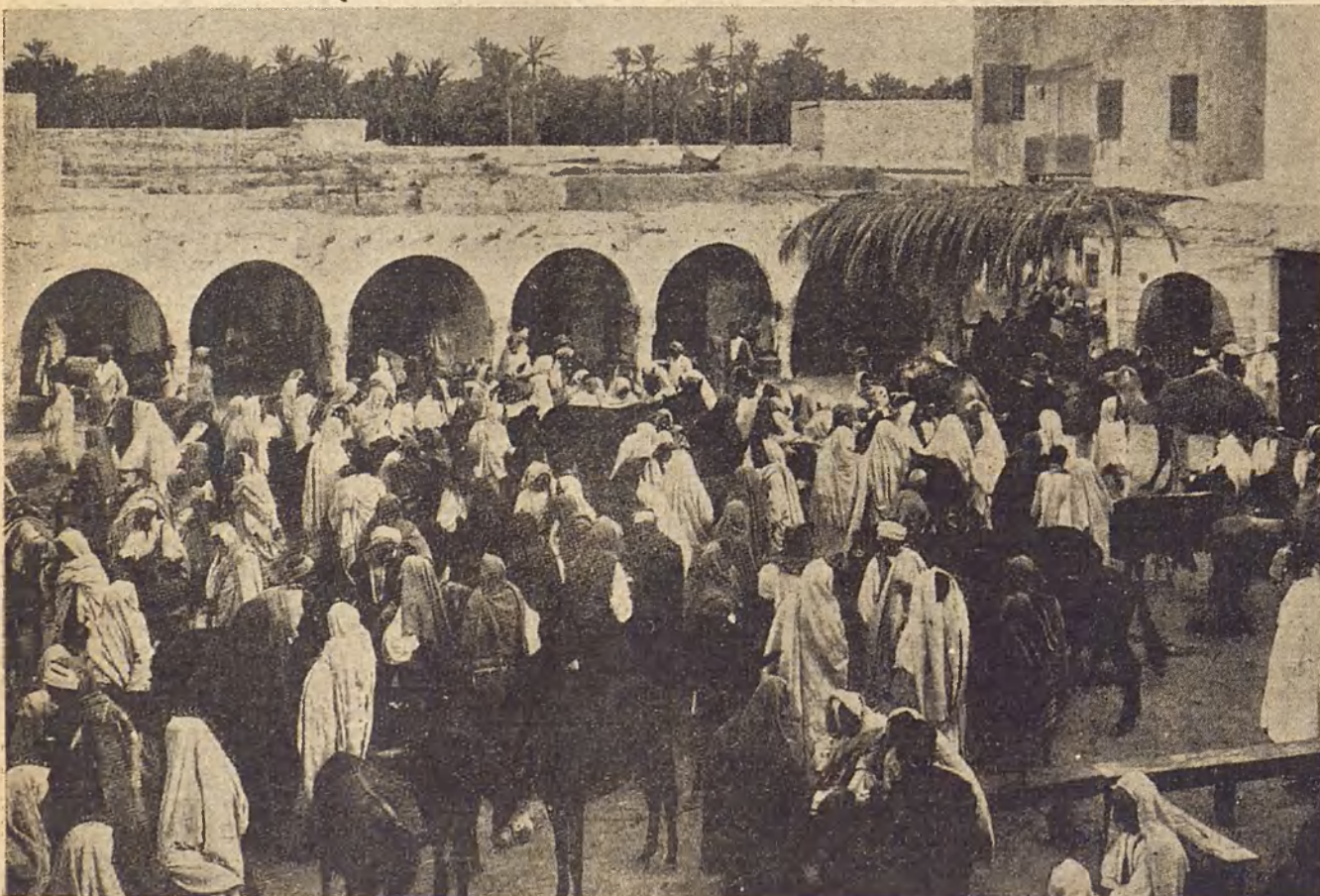
El "soko" en su apogeo. Ante esta abigarrada multitud, que les contempla sobrecogida de admiración y espanto, realizan los "aissanas" sus terribles ritos.