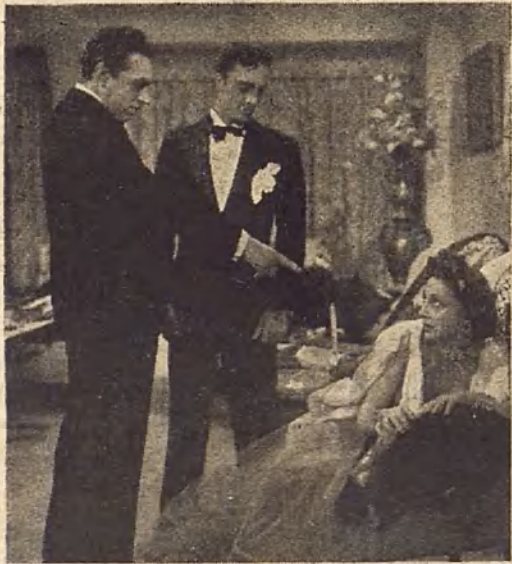
Una escena de Rápíteme usted , creación de Celia Gámez, que ha editado Cinedía y que la distribuidora Balet y Blay presenta el lunes en Rialto.