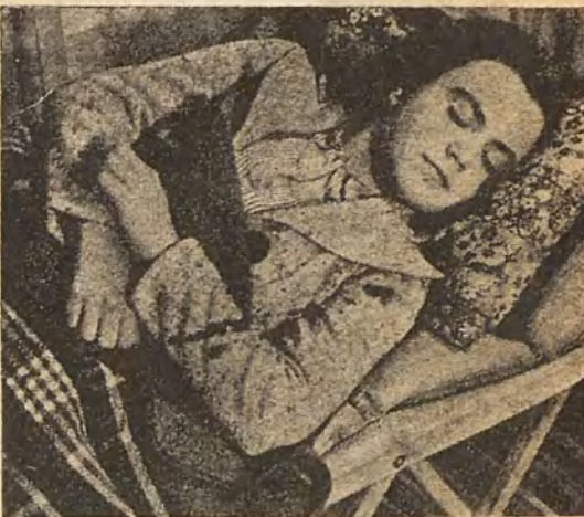
SIESTA. Cosa que se echa después de comer. Cuando se echa antes de comer es que es gripe.