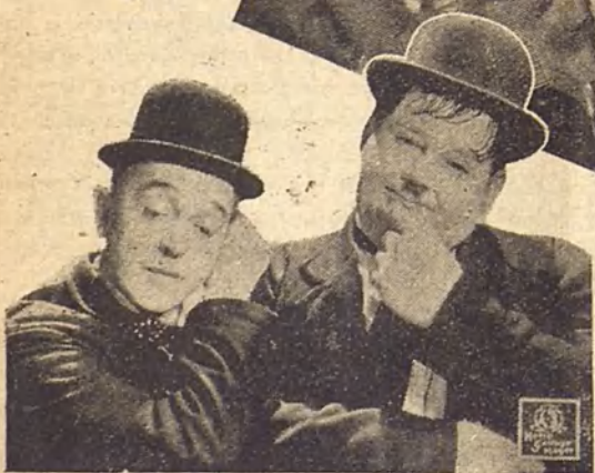
Laurel y Hardy en el Oeste es el título de la nueva película interpretada por los populares actores cómicos, que en este film triunfan una vez más como indiscutibles "ases" de la gracia.