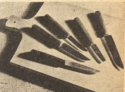
CUCHILLOS. Pedazos de cosa que sirven para pelar las patatas y otras veces para no pelar las patatas.