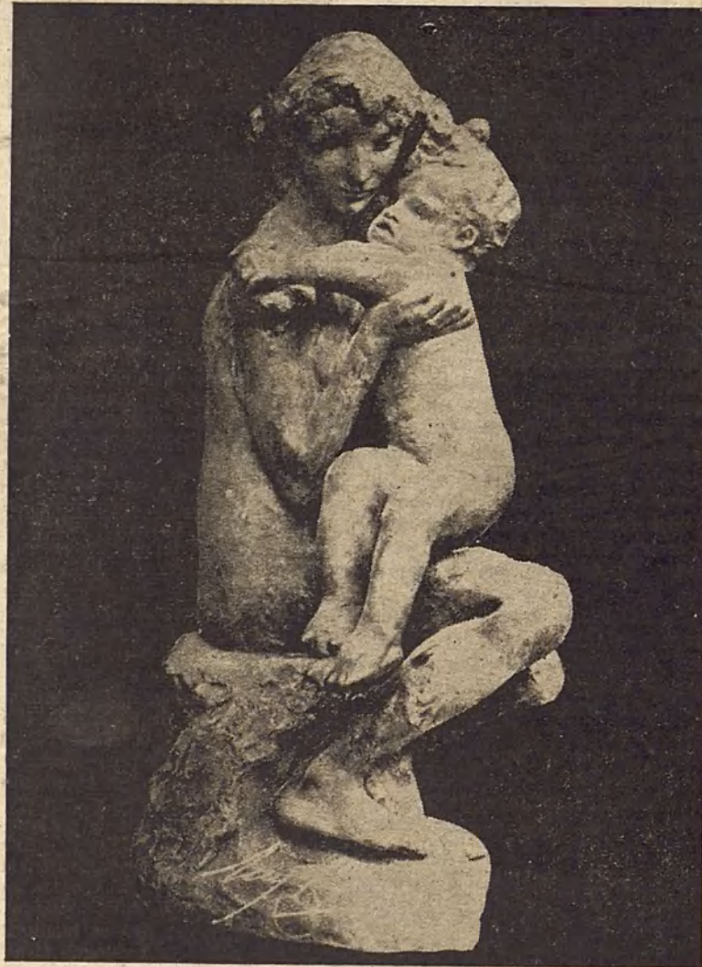
Hermano y hermana.

sayos bajo la dirección de Maindron, que le desquitaban del fracasado empeño por ingresar en la Escuela de Bellas Artes.