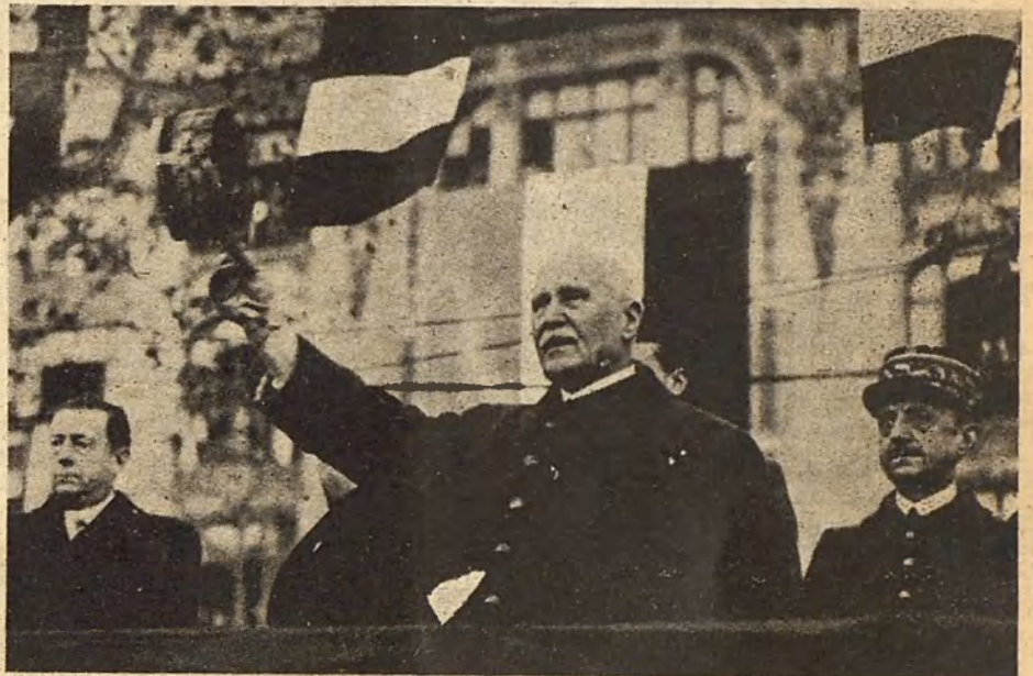
Recientemente, el Mariscal Pétain ha realizado un viaje por las ciudades de la Francia no ocupada. Aquí aparece en Toulon, saludando a la multitud que le aclama. Pese a tales muestras de cariño de su pueblo, el anciano Mariscal tropieza con grandes dificultades para afrontar y superar la situación de su país en derrota.

rarnos lo que hoy se advierte como un evidente peligro.