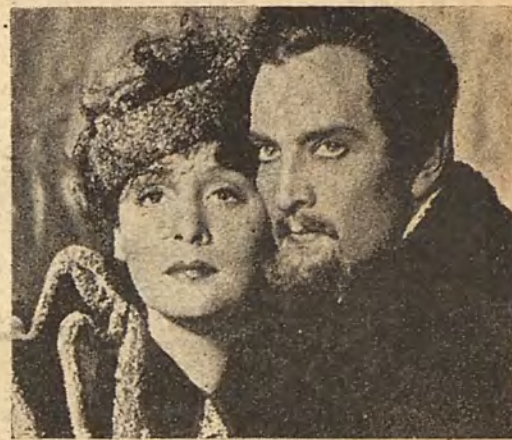
AMOR. Sensación que siente este señor de la barba en el momento de retratarse.