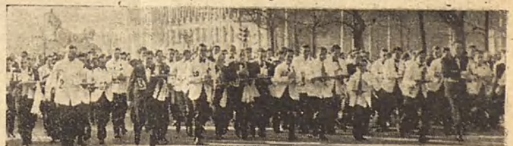
La carrera de los camareros. Momento de la salida.

Exito clamoroso de la prueba y de la organización. Ciento cincuenta artistas del mandil y de la bandeja corrian más que marchaban por entre una masa de público que no bajaría de 30.000 almas, optando al gran premio de los 1.000 duros.