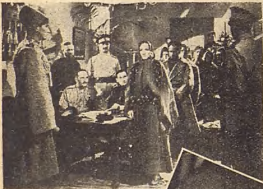
Marlene Dietrich en un dramático momento de La condesa Alexandra , que el Bilbao anuncia para su próximo programa.