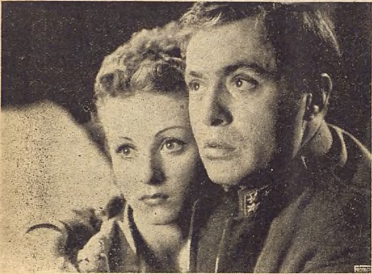
Danielle Darrieux y Charles Boyer, las dos figuras de Sueños de príncipe ("Mayerling"), acontecimiento de la temporada, que ha entrado con extraordinario éxito en su segunda semana de exhibición en el Palacio de la Música.