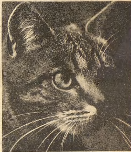
GATO. Cosa que se tiene en la cocina y que sirve para guardar las sardinas.