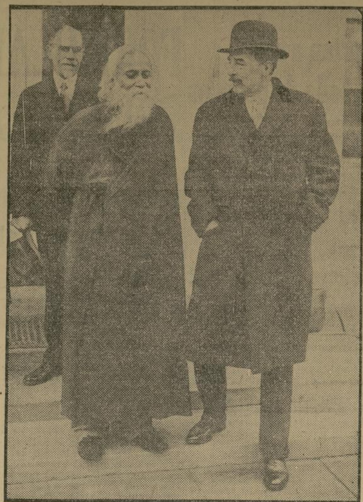
El poeta laureado y filósofo de la India, Rabindranath Tagore, saliendo de la Casa Blanca acompañado por Sir Ronald Lindsay, embajador de Inglaterra, después de haberse entrevistado con el presidente de Estados Unidos.