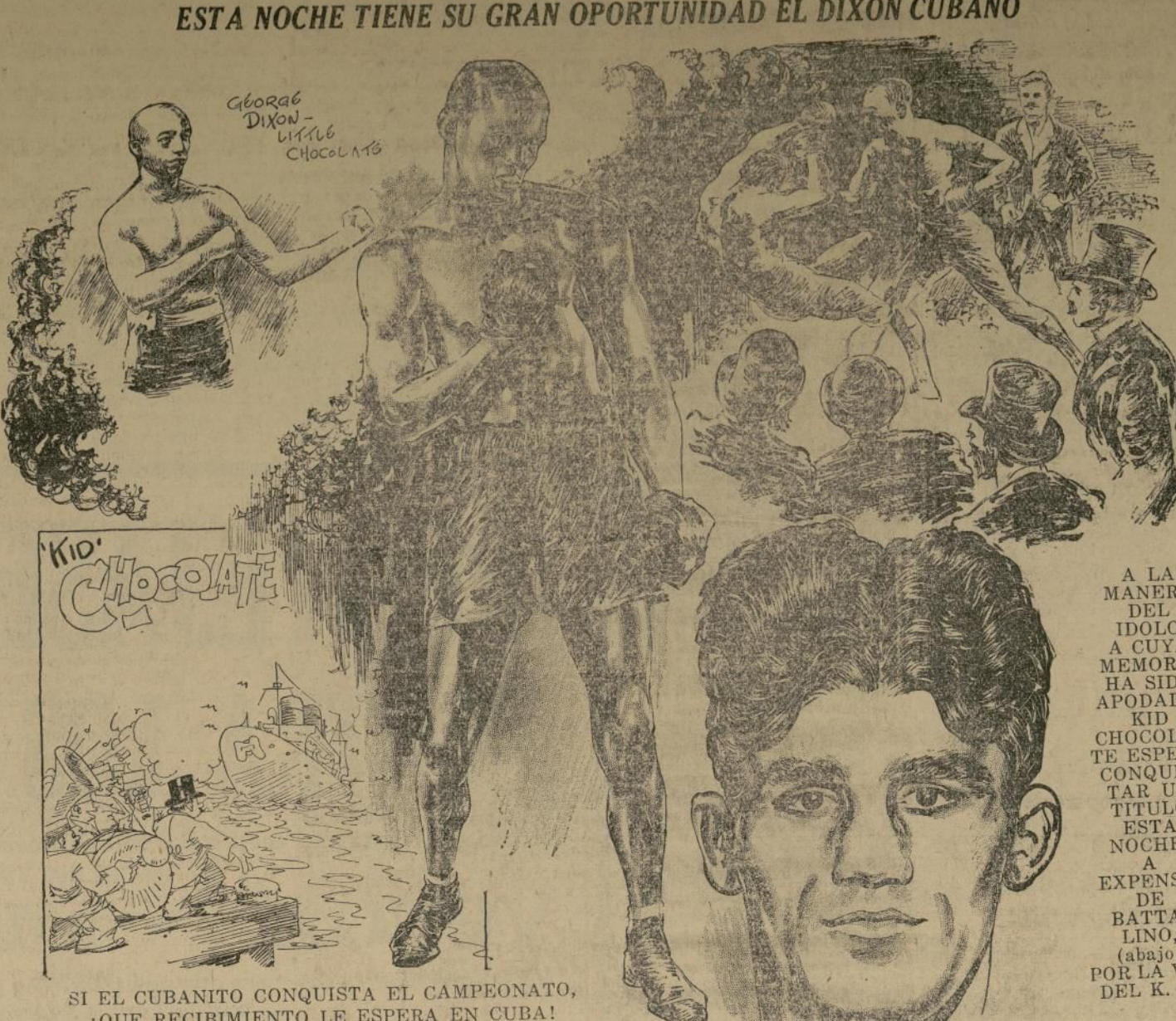
SI EL CUBANITO CONQUISTA EL CAMPEONATO, QUE RECIBIMIENTO LE ESPERA EN CUBA!

Historia del banco Organizado en 1913 con un capital de $100,000, el Bank of United States se desarrolló rápidamente después de la guerra mun-