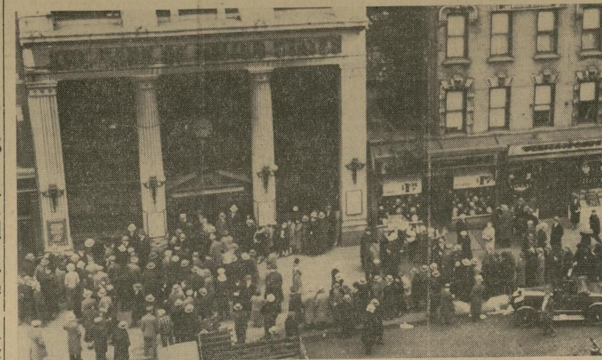
Los depositantes del Bank of United States, como resultado del pánico que provocó su cierre, se aglomeraban frente a todas las sucursales de la ciudad. Esta fotografía muestra los cientos de depositantes que aguardaban turno para retirar sus depósitos de la oficina del banco de la calle Delancey. Unos llegaron a tiempo y otros no.

Temía más de 400,000 depositantes y se desconoce cuánto recobrarán