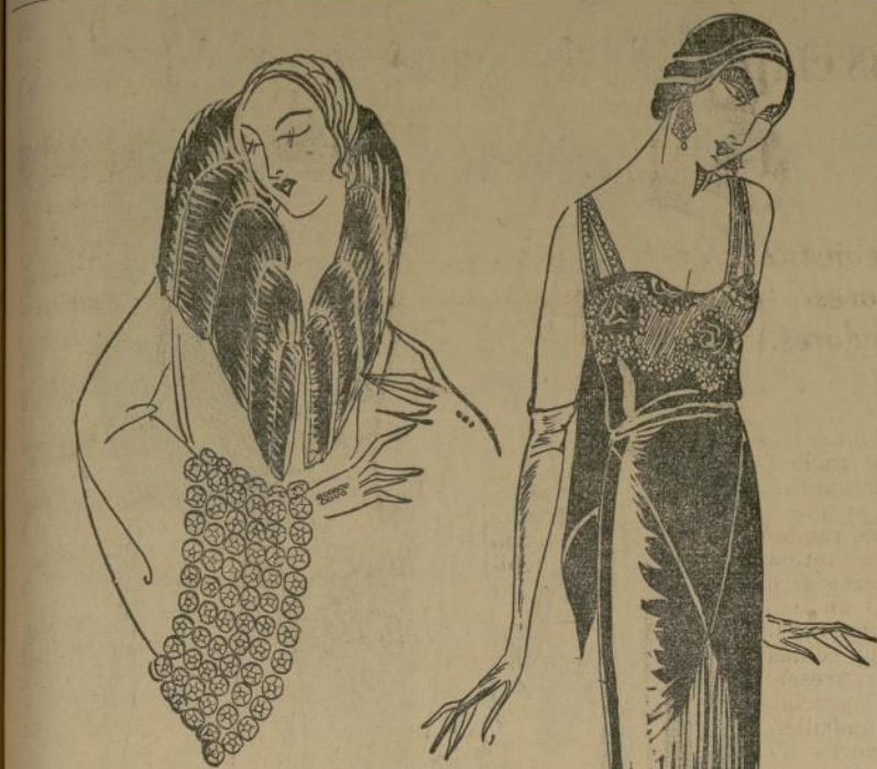
Precioso vestido de terciopelo negro, con escote drapado por detrás

A bordo del vapor "Ile de France", diciembre 11.— Como dije el otro día a la interrogadora de cómo puedo vestir las mujeres de reducido salario, lo principal es acomodarse a sí misma y saber los colores y estilos que le favorecen. Y hay algo más.