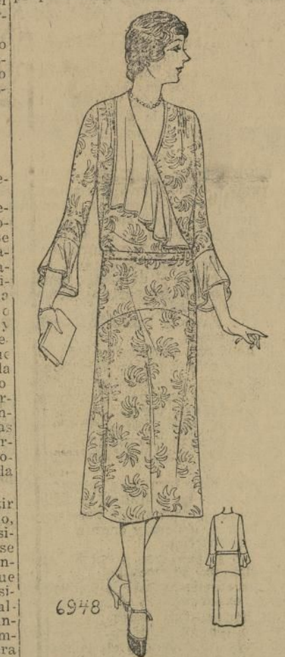
semilarga termina en un puño ancho.

6948. Este cierre al centro de la blusa con chorrera al lado es muy interesante. El canesú de la falda es vuelto hacia arriba y se une a la blusa, que abombacha un poco. Las alforforas de los hombros le proporcionan suavidad. La manga