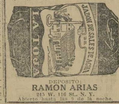
DEPOSITO: RAMON ARIAS 245 W. 116 St. N. Y. Abierto hasta las 9 de la noche.