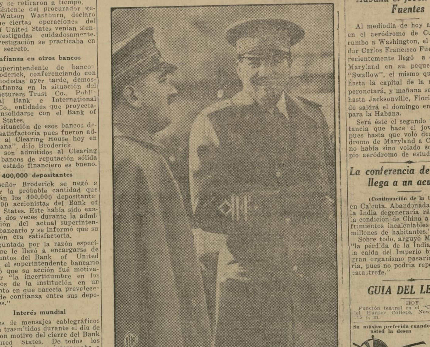
El ministro de aviación italiano general Italo Balbo (a la derecha) conversando con su jefe de estado mayor, Umberto Valle, en la base de Ortovello, Italia. Ambos tienen que tripular el Savoia Marchetti No. 1, que irá a la cabeza de una escuadrilla compuesta de once aparatos más, que Italia envía de visita a la América del Sur.

En 1928 y 1929, como resultado de una serie de consolidaciones, aumentó notablemente su capital y reservas así como el número de sucursales. En mayo de 1928 el Bank of United States obtuvo el control del Central Mercantile Bank and Trust Company, quedando capitalizado en $175,000,000. En agosto del mismo año se consolidó con el Colonial Bank y el Bank of Rockaway, aumentando el capital combinado a $200,000,000 y contando el Bank of United States con 37 sucursales. Un mes después absorbió al Municipal Bank and Trust Co., adquiriendo así veinte nuevas sucursales y aumentando su capital a $250,000,000 con reservas de $40,000,000. Recientemente, varias demandas fueron presentadas a los juzgados locales, acusando al Bank of United States de fraude en la venta de acciones, al negarse la institución a comprar varias de éstas por su valor anunciado.