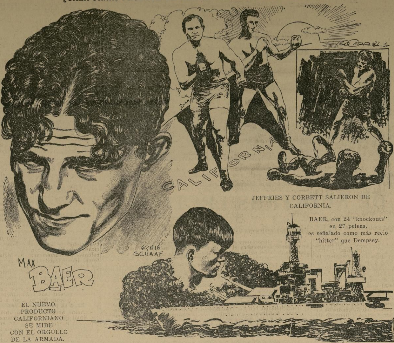
EL NUEVO PRODUCTO CALIFORNIANO SE MIDE CON EL ORGULLO DE LA ARMADA.