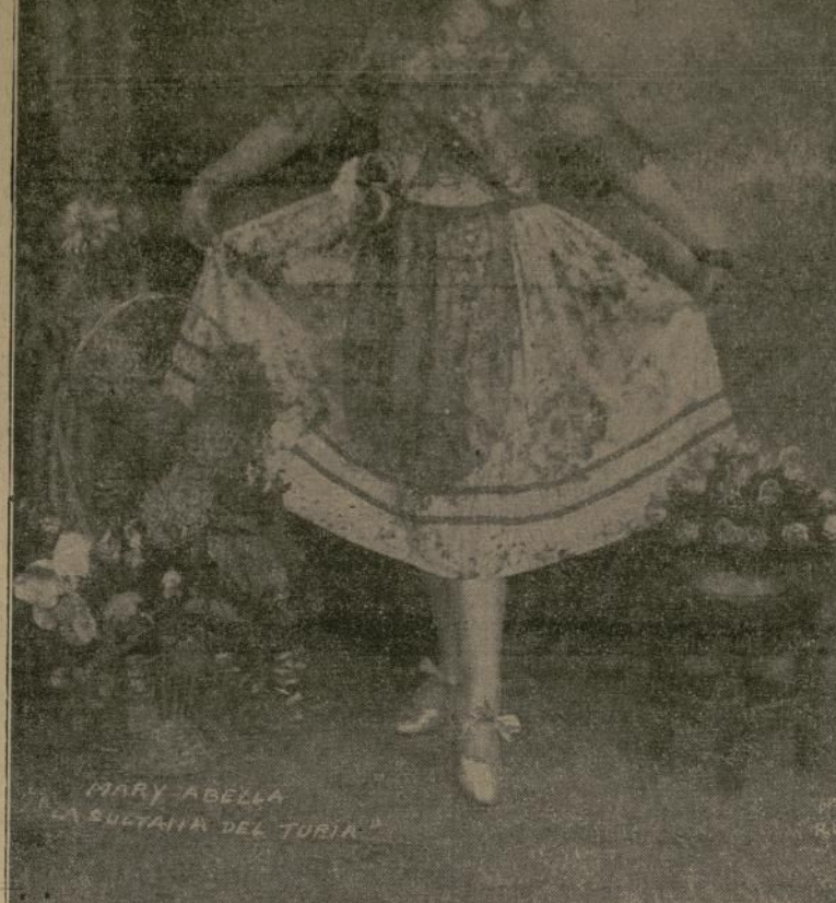
Joven artista de bailes flamencos que tomará parte esta noche en el programa que para la función de gala ha preparado el Círculo Valenciano

7.30 P. M.—Programa Crosey. 8.30 P. M.—Variedades. 9.30 P. M.—Velada pugilística, Ridgewood Grove. 11.00 P. M.—Orquesta Arcadia. 11.30 P. M.—Orquesta Club Plaza.