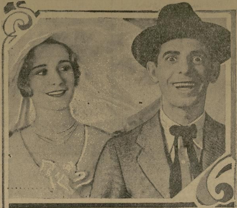
Eddie Cantor y una de sus encantadoras "cómplices" en la grandiosa revista "Whoopie", que empieza a exhibirse hoy en el "Mt. Morris".

TAQUIGRAFAS, estén o no empleadas: publiquen en LA PRENSA un anuncio clasificando. Tendrán abundantes contestaciones. Las que trabajan pueden mejorar su situación. No publiquen nombre ni domicilio. Pueden hacer dirigir las respuestas a nuestra oficina.