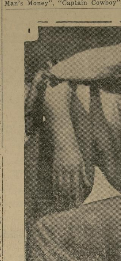
Adèle Astaire, una de las razones principales del éxito de "Smiles", la última revista que se halla en el "Ziegfeld".