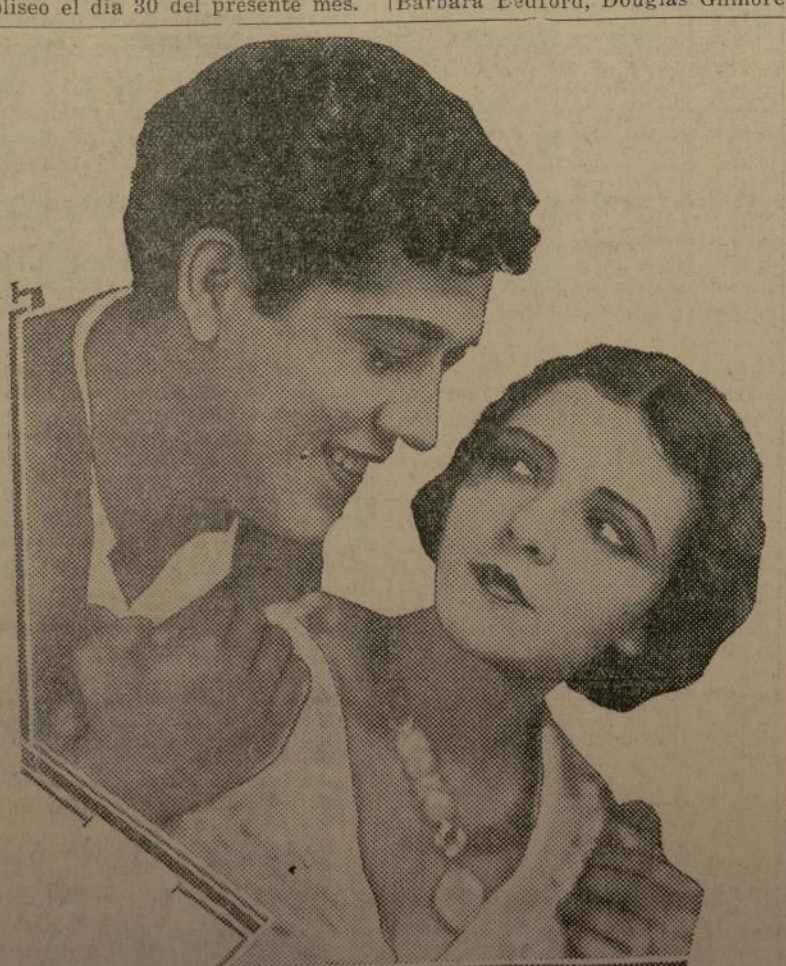
José Mojica y Mona Maris en "Cuando el Amor Ríe", la cinta que empezará a exhibirse en el "San José" el próximo viernes.

El reparto de la misma no puede ser más prominente. Entre los artistas que lo integran se encuentran Bárbara Bedford, Douglas Gilmore,