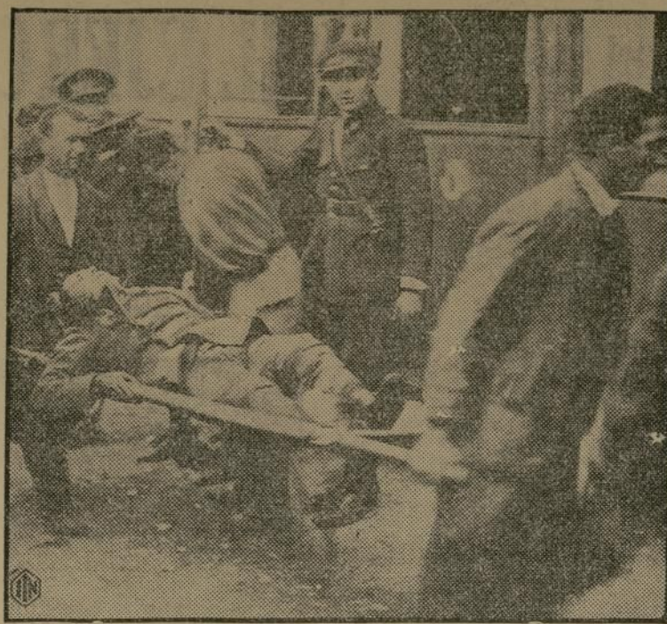
Soldados leales españoles conduciendo al hospital a uno de los revolucionarios heridos en la captura por el gobierno de la fortaleza de Jaca.