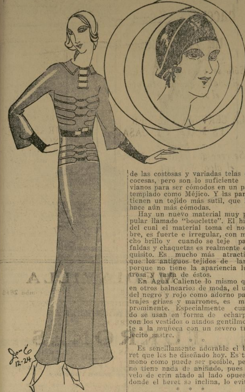
Lindo modelo en grueso crepe morado azulado, largo, con adornos en charol blanco y negro.

PARIS, diciembre 19.—Todas las clases de materiales que se usan este año son variadas, según la ocasión. Y encantadores! En el Casino, Agua Caliente, México, por ejemplo, se usan mucho los tweeds livianos, materiales tejidos y pana, con la total exclusión de sedas. Pero ya no son los materiales opacos y desaliñados de otras épocas. Los tweeds tienen toda la apariencia lujosa, grueso y delicadeza.