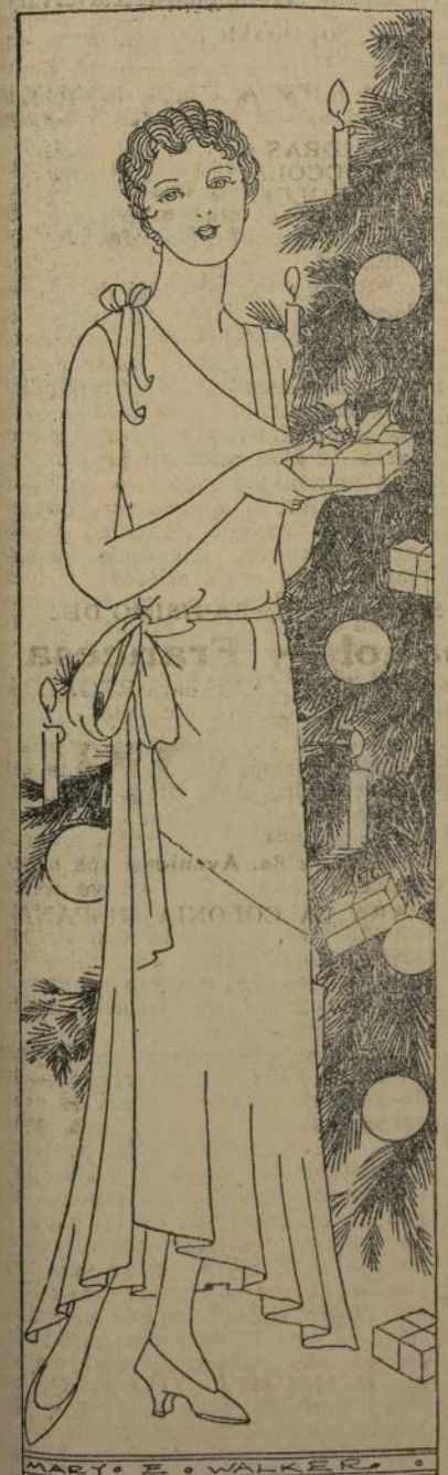
Oportunos regalos de última hora

Todos debemos tener a mano algunos regalos de Navidad para casos inesperados. Puede ser que hubiese olvidado a alguien al enviar sus presentes, lo cual sucede con bastante frecuencia, y en el último