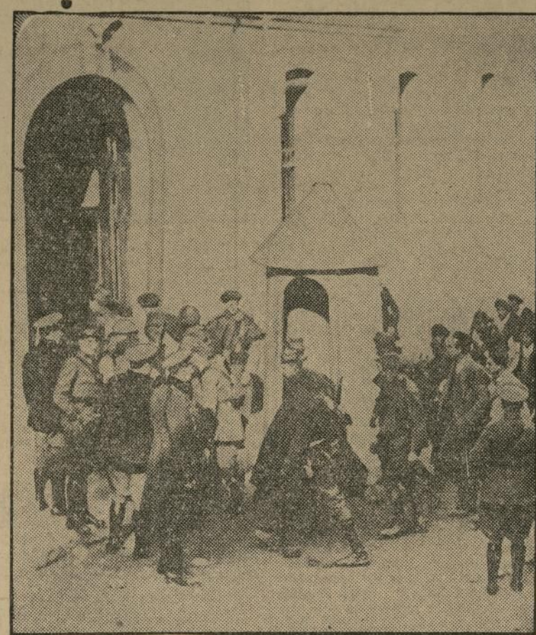
Tropas españolas conduciendo a una prisión militar de Zaragoza a prisioneros capturados en la represión de la reciente sublevación militar de Jaca.