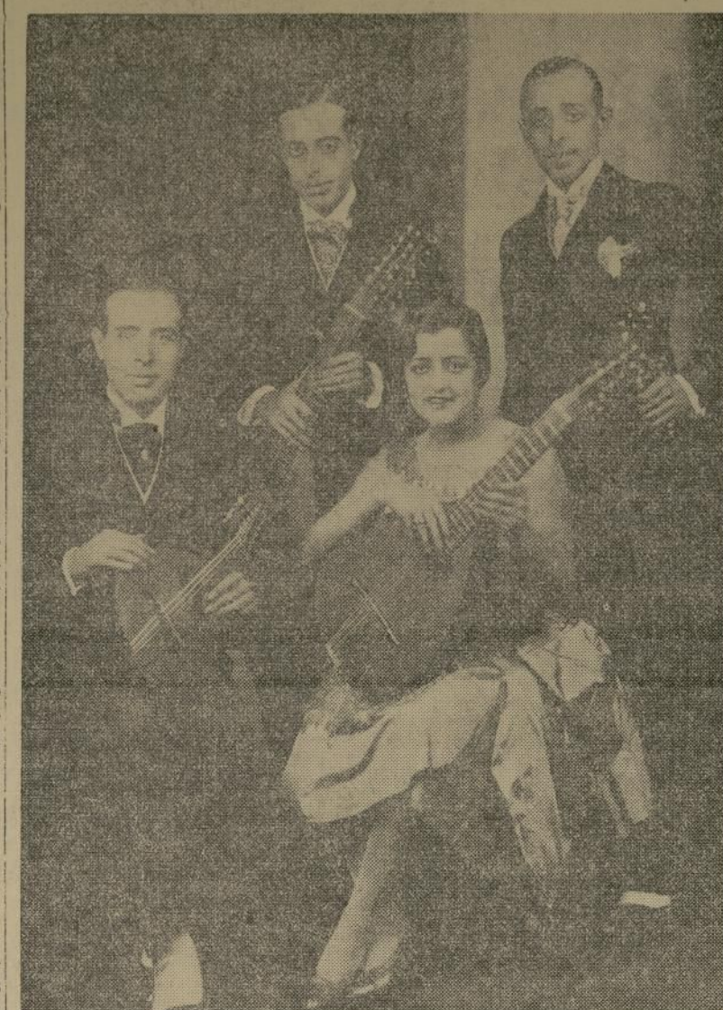
Los ya mundialmente famosos artistas Ezequiel, Paco, Elisa y Pepe Aguilar, en su primer concierto de Nueva York este año.

noce ni ha encontrado en el mapa. Se encuentra a bastante distancia de Sagebrush y en muchas millas no existe un árbol. O'Brien voló en circunferencia sobre la escuela, de la cual salieron el maestro y sus discípulos y volando a una altura de 500 pies dejó caer el árbol que llevaba. Poco tiempo después veía cómo le entraban en la escuela, con gran contento de los niños.