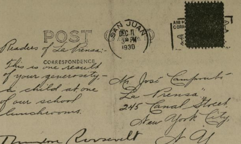
El gobernador de Puerto Rico, coronel Roosevelt, acaba de enviar a nuestro director la tarjeta postal cuyo anverso y reverso aparecen reproducidos en el grabado. Nada más docente y patético podría decirse, por el cívico ejecutivo boricuano, en honor de los lectores de este diario que contribuyeron al envío de socorros para los niños pobres escolares de Puerto Rico.