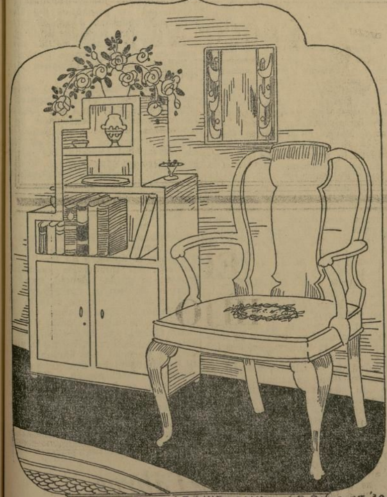
Artística combinación de muebles nuevos y antiguos

Muchas casas tienen redecorado todo el mobiliario moderno, vamos a pensar en combinar éste con el antiguo. La característica, marca de los muebles modernistas es que son angulares. Los de otras épocas son de líneas más suaves y curvas. Así que las duras y severas líneas de los muebles modernos