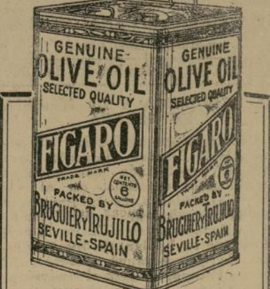
Aceite Puro de Oliva Español, EL MEJOR

"Esta paradoja de traer hielo del trópico al norte no tiene precedentes".