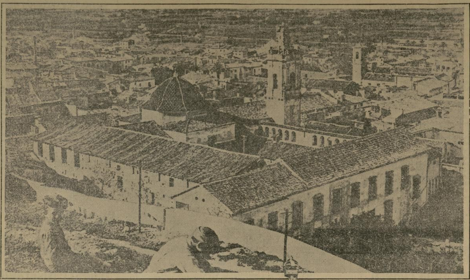
Arrestados y juzgados los jefes del reciente golpe militar de la fortaleza de Jaca y sofocada la sublevación en todas sus fases, la más completa tranquilidad y el orden absoluto vuelven a imperar en la pequeña población fronteriza.

ABSOLUTA TRANQUILIDAD EN EL TEATRO DE LA RECIENTE SUBLEVACION MILITAR ESPAÑOLA