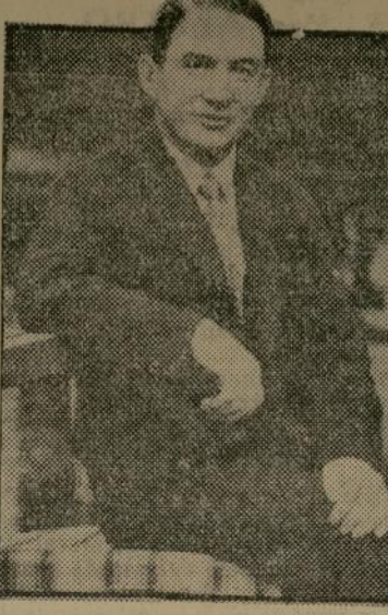
Steve Donoghue, el mejor jockey de Inglaterra y único en la historia que ha ganado seis premios Derby en seis años, gozando de unas vacaciones en el templado clima de la Habana.

En Ginebra desde hace muchos años, se dirige a Panamá en misión especial relacionada con el viaje que actualmente hace por algunos países de Hispano América el secretario general de la Liga de Naciones, Sir Eric Drummond.