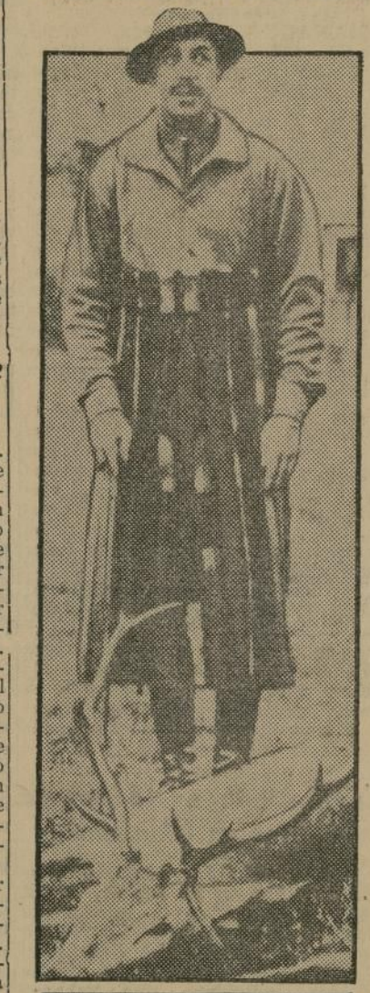
Como si las recientes manifestaciones anti-monárquicas no le causaran la menor preocupación, don Alfonso XIII aparece aquí en una hermosa pieza cobrada durante una reciente partida de cacería en San Bernardo.