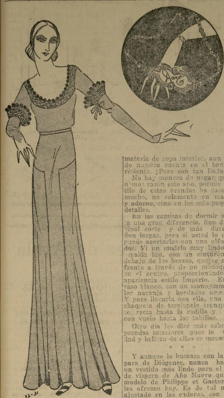
Adorable vestido de noche en tul negro con tabloncitos en la falda

PARIS, diciembre 26.—Algunas mujeres bonitas (contándose entre ellas), no están nunca satisfechas de lo que leen, ven y compran en