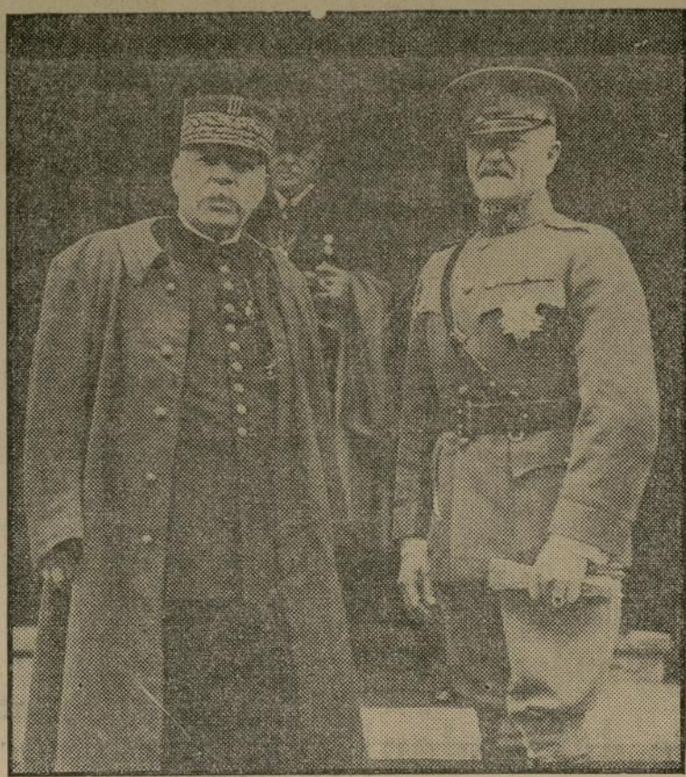
Interesante fotografía tomada hace algunos años en Washington en la cual aparece el vencedor de la primera batalla del Marne, mariscal Joffre, acompañado por el general Pershing durante una visita que el primero de los generales hizo a la capital de esta nación.

Vaticinase que las alteraciones submarinas terminarán y haga hoy buen tiempo.—Ministro en viaje de estudios.—Arriba un nuevo diplomático.