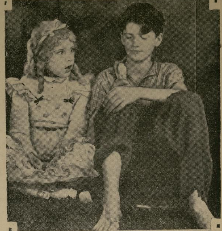
Mitzi Green y Junior Durkin en una escena de la versión cinematográfica de "Tom Sawyer", la novela de Mark Twain, actualmente en el "Paramount".

disfrutamos, y que valió a la artista nutridos y continuos aplausos, que la obligaron a salir repetidamente al escenario a corresponder al público.