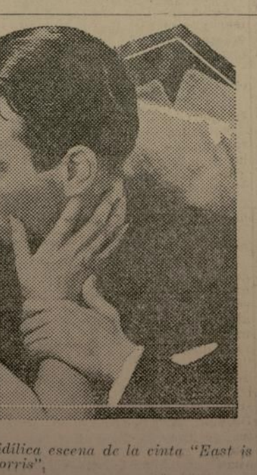
Lupe Vélez y Lew Ayres en una idílica escena de la cinta "East is West", que se exhibe en el "Mt. Morris".

HOY Baile de despedida de año en el Club Esperanza, a las 9 p. m. Baile de Noche Vieja en Casa de Galicia, a las 9:30 p. m. Vuelta de baile en el Centro Andaluz de Brooklyn, a las 9:00 p. m. Baile de despedida de año en el Centro Español de Elizabeth, N. J., a las 9 p. m.