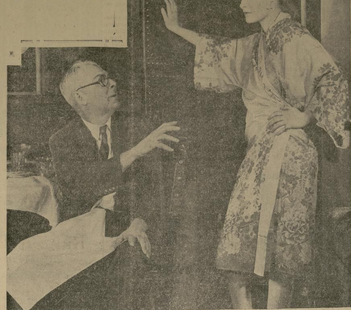
Lupe Vélez y Lew Ayres en una idílica escena de la cinta "East is West", que se exhibe en el "Mt. Morris".