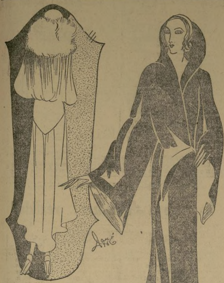
Preciosas abrigos de noche para invierno

PARIS, septiembre 2.—Aunque aun pueden usarse los paletots cortos para reuniones, bailes informales, las ocasiones formales requieren el uso de un abrigo o capa larga de innegable elegancia. La nota original en estos abrigos son las mangas, que son largas y anchas de nuevo, dando una nota muy caprichosamente elegante a la prenda esta holgada en la parte superior, cuando el resto hasta la rodilla es de líneas sobrias y sencillas, cayendo en graciosos pliegues hacia abajo.