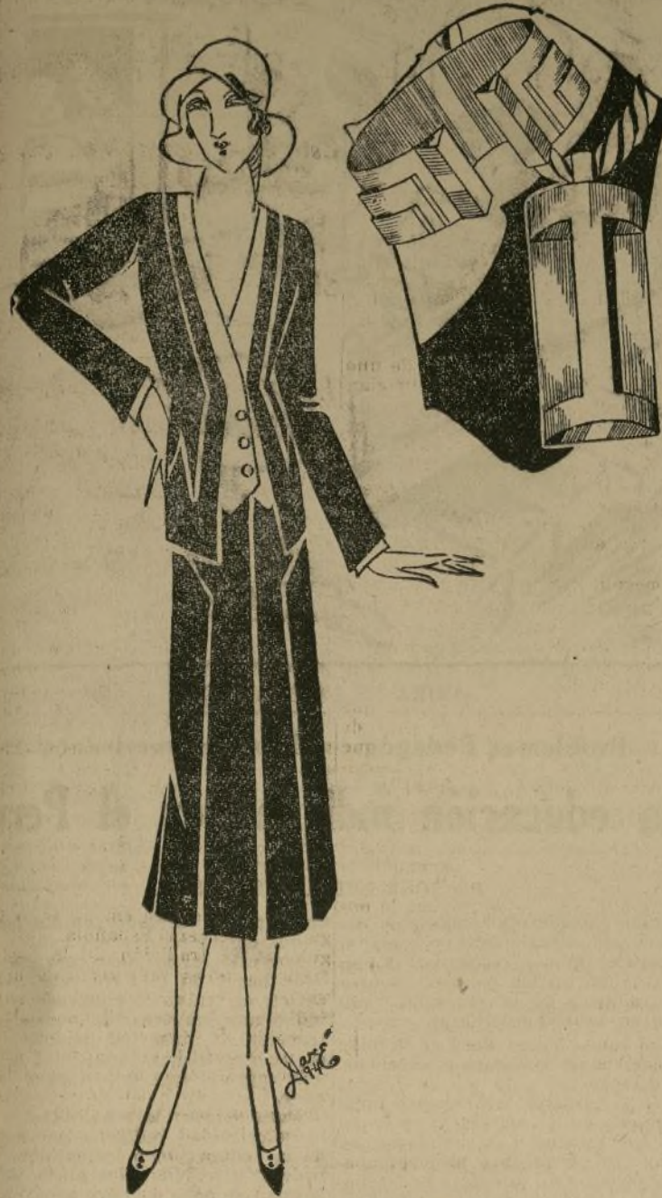
Elegante traje sastre negro y blanco