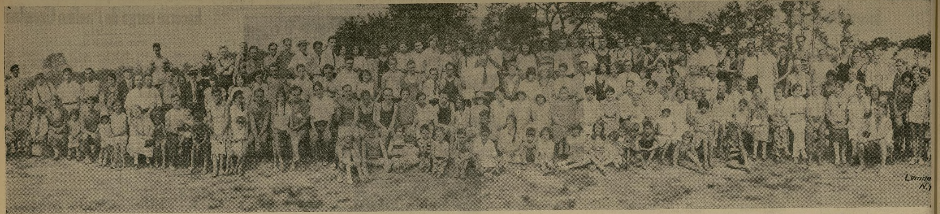
Parte de los numerosos excursionistas que asistieron el domingo pasado al campamento veraniego de la Sociedad Naturista Hispana en Annadale, Staten Island, donde se celebraron diversos juegos atléticos y otros actos.