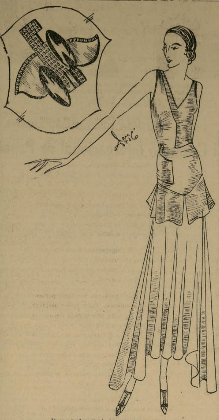
Encantador traje en georgette verde

PARIS, agosto 28.—"Pero, ¿qué utilidad tiene esto?", exclama casi airado el joven mostrando a su compañera un minúsculo pañuelito bordado de encaje.