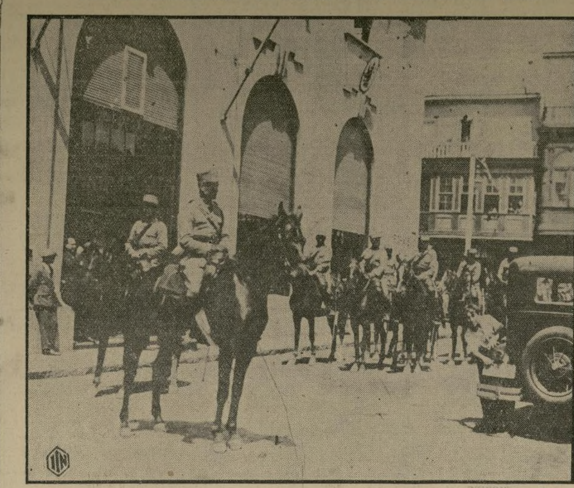
Tropas de caballería peruanas guardando la embajada de los Estados Unidos en Lima a raíz de la caída del presidente Leguía, quien como se sabe ha sido substituido por el coronel Sánchez Cerro, que ha formado nuevo gobierno.

HABANA, Cuba, 8 de septiembre. (P.)—El diario "El País" publica una información de su corresponsal en Palma Soriano, provincia de Oriente, la cual hallase según estos informes en estado de sitio, como prevención de disturbios políticos.