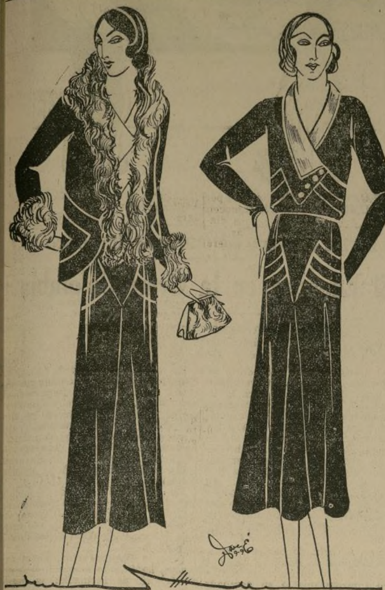
Lindo "ensemble" rojo cubido, estilo "Picolo"

PARIS, septiembre 4.—Las flores son las "estrellas de la tierra", como dijera algún poeta. Nos ofrecen un grato aroma y están al servicio de la mujer para aumentar su encanto. Los orientales, que rinden culto a la belleza, lo comprendieron desde tiempo inmemorial. Casi todos sus tocados están adornados con flores, ejemplo de ello los usados por los indios en sus danzas. No hay nada más favorecedor que las flores cayendo sobre el rostro, colocadas con gusto artístico.