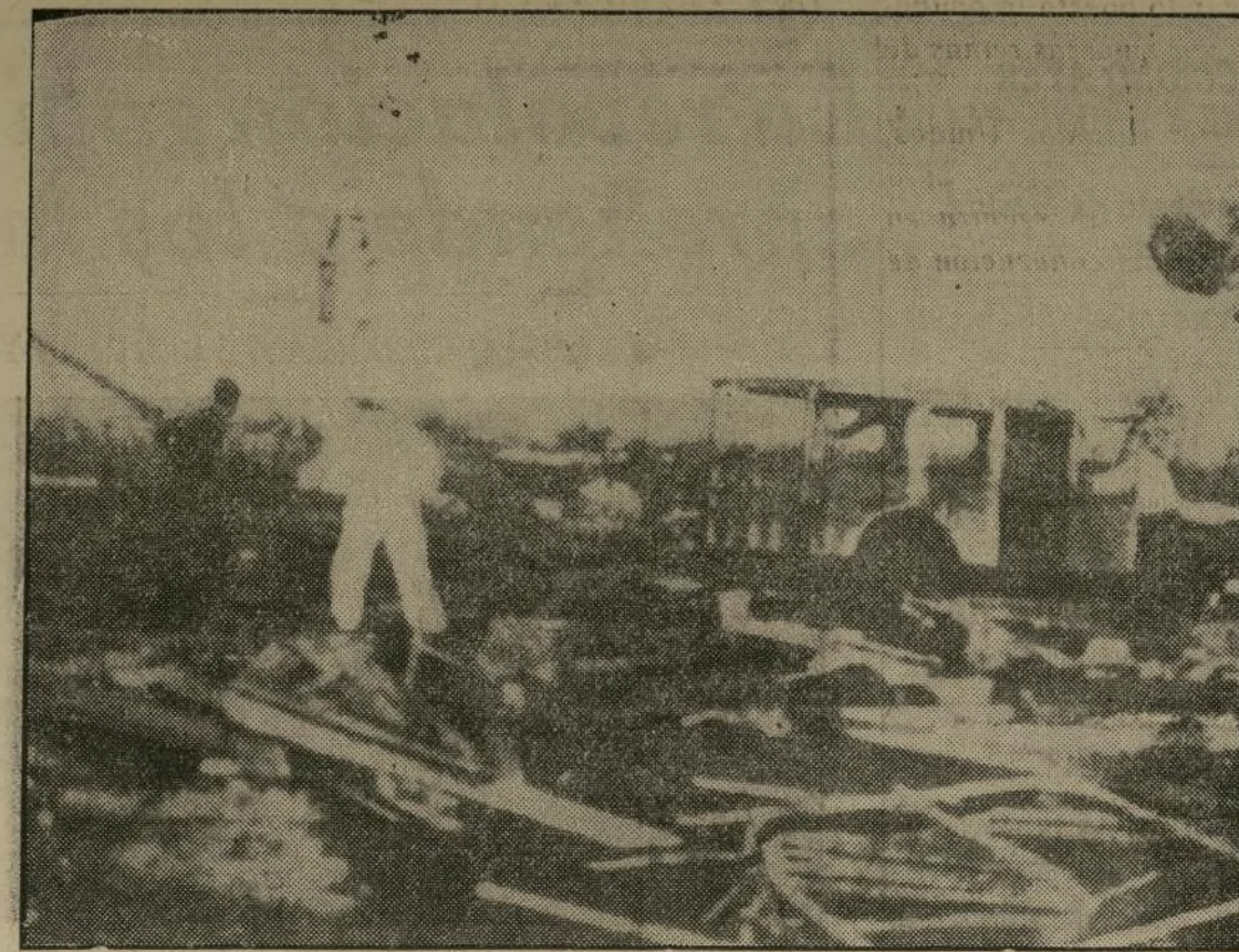
El grabado representa un sobrevuelo buscando los restos de seres queridos entre las ruinas de la hermosa ciudad de Santo Domingo, recientemente destruida por el huracán, que causó más de 5,000 muertos y dejó sin hogar a 36,000. La población de la ciudad era de 40,000 habitantes.