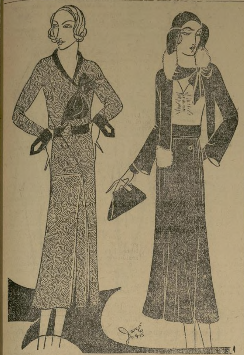
VESTIDO Y ENSEMBLE DE ELEGANTES LINEAS

PARIS, septiembre 10.—Son los vestidos tan bonitos ahora! He podido privarme, con un soberano esfuerzo de voluntad, de uno de los últimos modelos de la época de Luis XV, confeccionados en gamuza beige, celeste pálido, rosa pálido y amarillo, con intrincados bordados a mano y adornos trenzados.