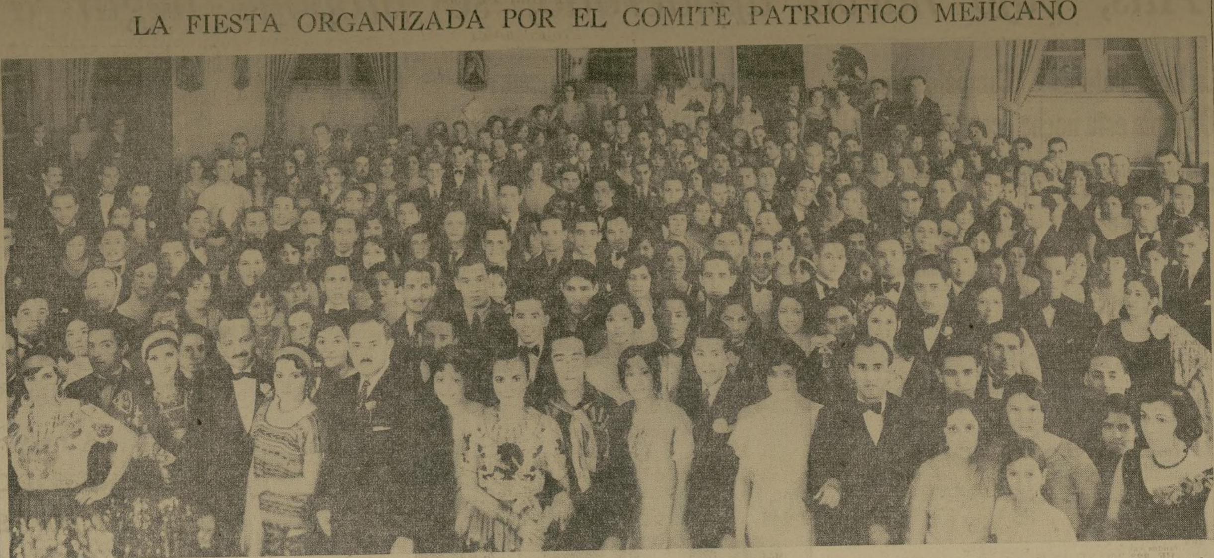
Una nutrida representación de la colonia mejicana concurrió al baile celebrado el lunes último, para conmemorar el 120 aniversario de la independencia de su patria.

El "Fomento" sufrió una avería a consecuencia de la cual hace agua, pero no hubo víctimas en el accidente.