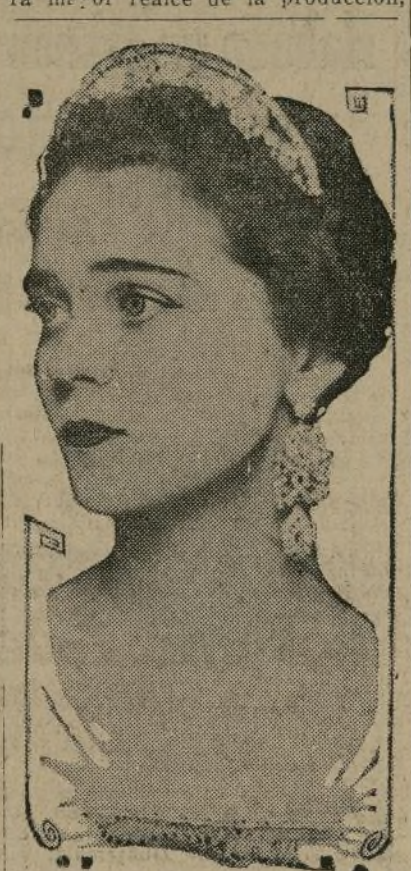
Miss Eva Le Gallienne, fundadora y directora de la Civic Repertory Company.

Y todo esto es soberbiamente, insuperablemente presentado por los Shubert, que pusieron en juego, para mayor realce de la producción,