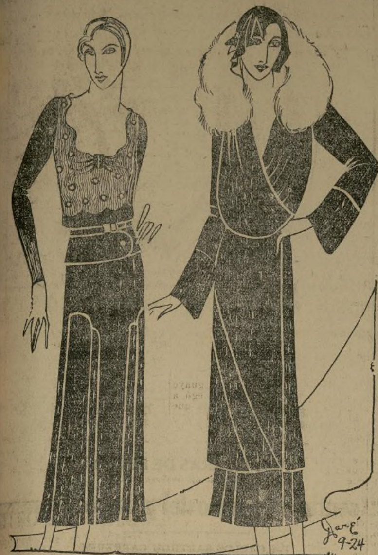
Elegantísimo conjunto de traje y abrigo de lana en morado y blanco; la blusa es de shantung en un tono morado más claro bordada en lana.

PARIS, septiembre 19.—Ahorra una vez para siempre cómo debe las pijamas para boudoir no son de raso o crepe, sino de lana suave. Lo cual, según mi opinión, es más práctico y cómodo, especialmente en ciertos países donde la calefacción no es tan eficiente como en los Estados Unidos.