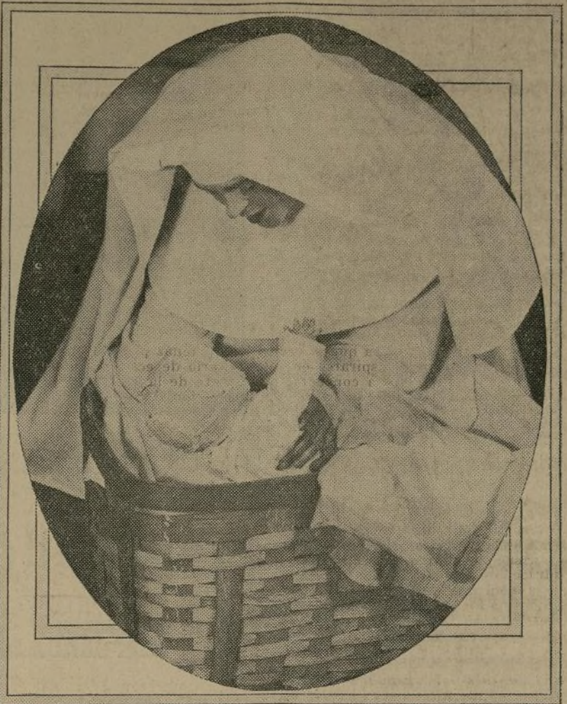
Miss Eva Le Gallienne en el papel de la monja en "Canción de Cuna", el bellísimo drama de Martínez Sierra.