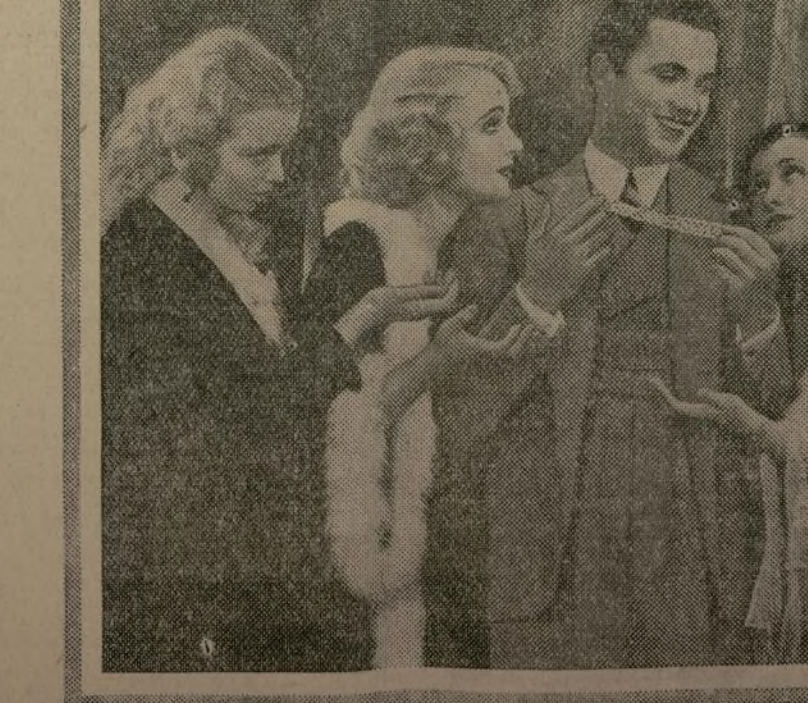
Virginia Bruce, Carroll Lombard, Charles "Buddy" Rogers, Kathryn Crawford y Josephine Dunn en "Safety in Numbers", que empezará a proyectarse mañana en el teatro "Morningside".