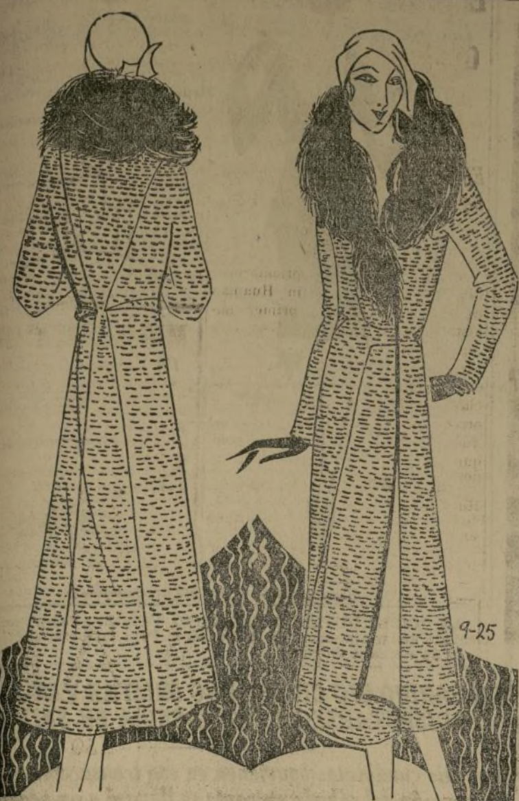
Elegante abrigo color beige y negro, adornado con cuello de piel de zorro marrón

PARIS, septiembre 20.—El abrigo de noche de hace dos años. Si usted es una persona irascible, con seguridad que aun no se ha decidido a hacer nada para acortarlo en forma de un abrigo corto o anudado una especie de banda en la parte inferior para alargarlo. ¡Pero estáis de pié en la benéfica! Nuestra Señora La Moda, ha solucionado este problema por vosotras! Y lo mejor es que usad el abrigo de hace dos años que con los vestidos tan cortos llegaba al ruedo, es en esta estación un abrigo para noche semi-corto, muy elegante y la última palabra en esta clase de abrigos, muy chic cuando se sabe lucir con gracia sobre un largo traje de noche.