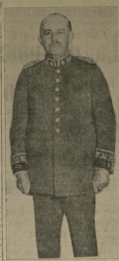
General Agustín P. Justo

Quiere investigación completa de la compra de armamentos cuando era ministro.—"La revolución bien reportada".—El ministro de Hacienda da orden de pagar los cupones de la deuda.