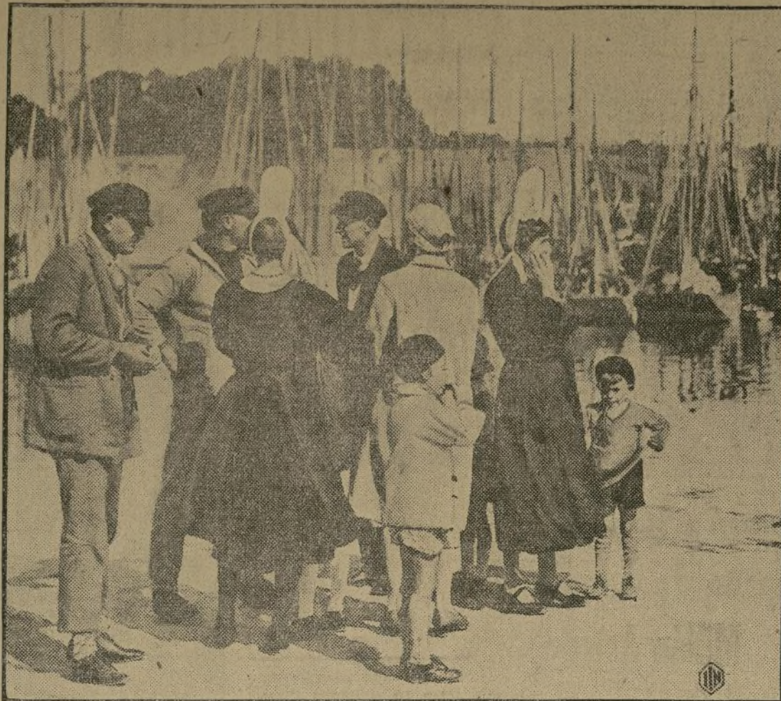
Dolorosa escena en el pequeño puerto de Concarneau (Francia) en la cual se ven las esposas de algunos pescadores esperando a sus maridos por haber perecido en los numerosos naufragios de barcas pesqueras que se produjeron durante el gran temporal que azotó las costas occidentales de Francia recientemente.

ESPERANDO A LOS MARIDOS QUE NUNCA VOLVIERON