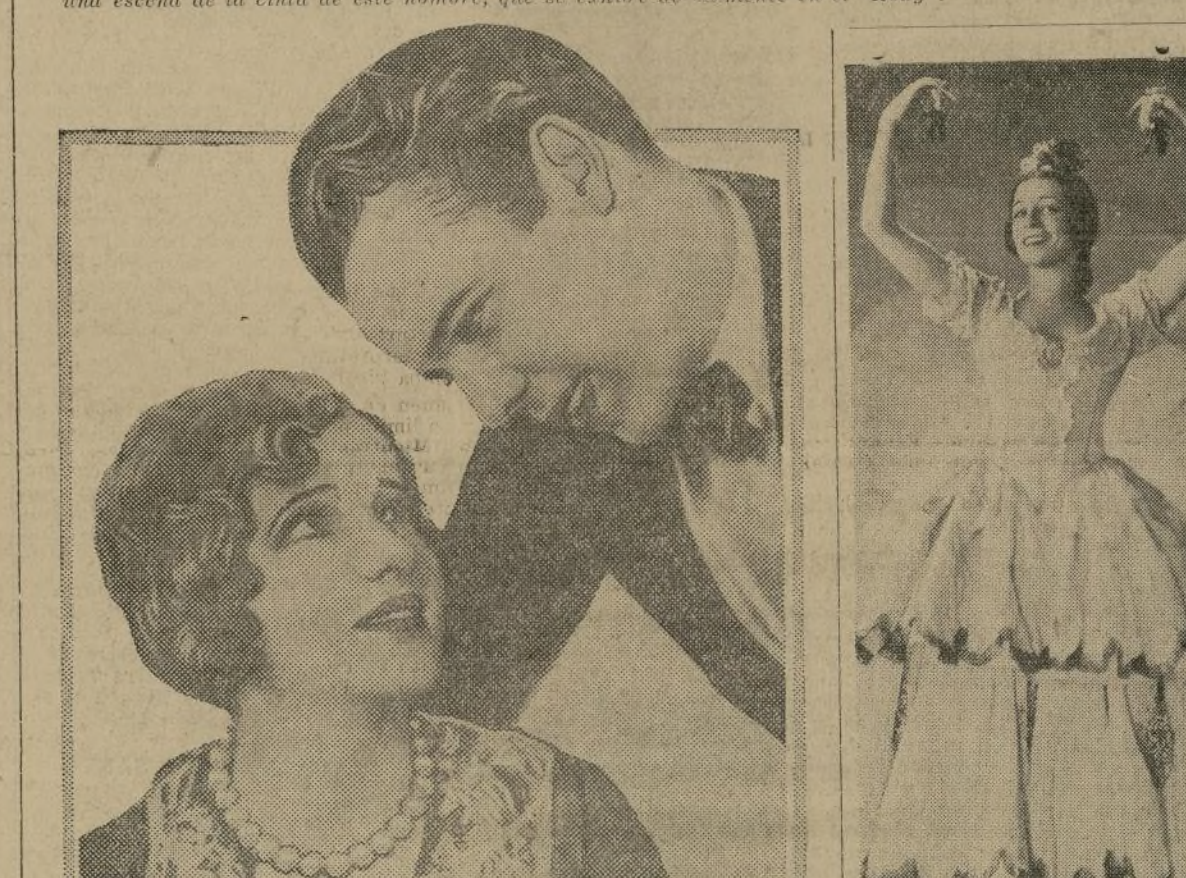
Walter Huston y Dorothy Revier, los personajes de la bella película "The Bad Man", que empezará a exhibirse en el "Regent" el próximo sábado.