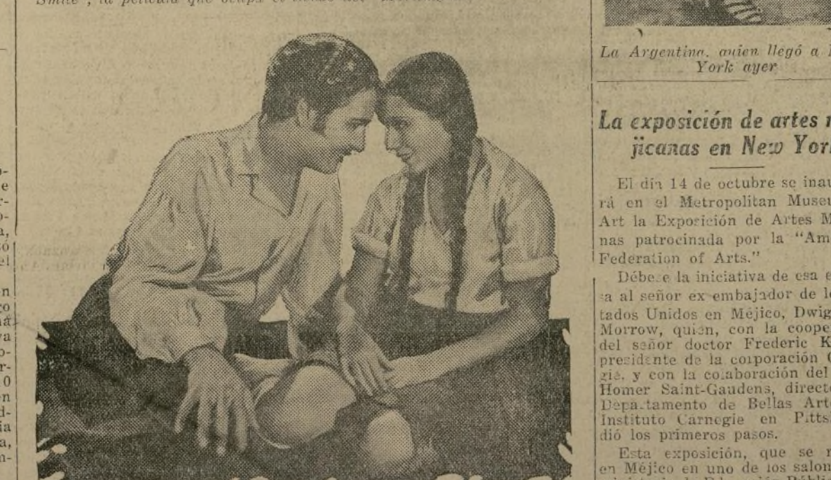
Dixie Lee y Arthur Lake en una encantadora escena de "Morning Side", la película que ocupa el tiempo del "Morningside".