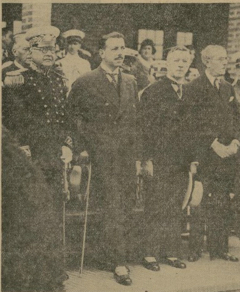
El presidente electo doctor Julio Prestes (con bastón) durante un desfile militar en Sao Paulo, Brasil, recientemente durante las fiestas de celebración del aniversario de la independencia.