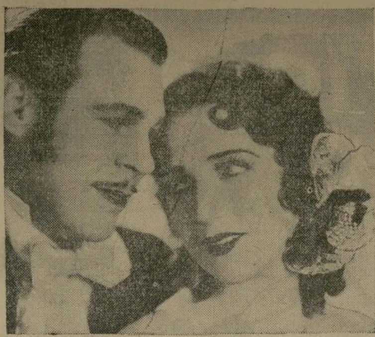
Bebe Daniels, la bellísima actriz de origen colombiano, y Everett Marshall, intérpretes del drama musical cinematográfico "Dixiana", que se empezará a exhibir mañana en el "Jewel".